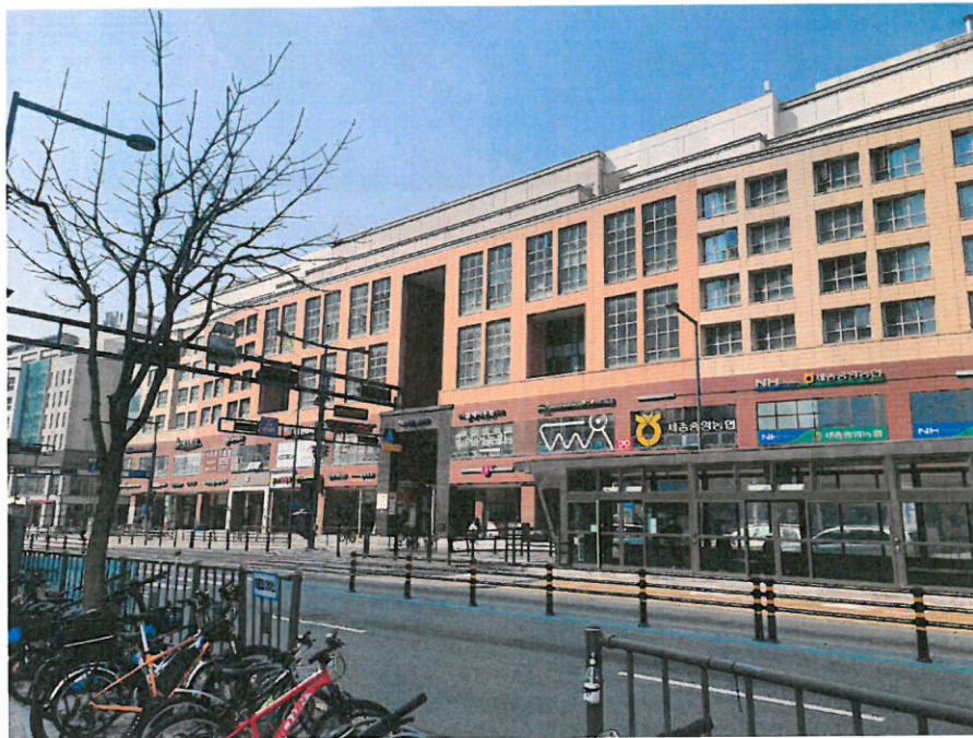
본 단지 전경