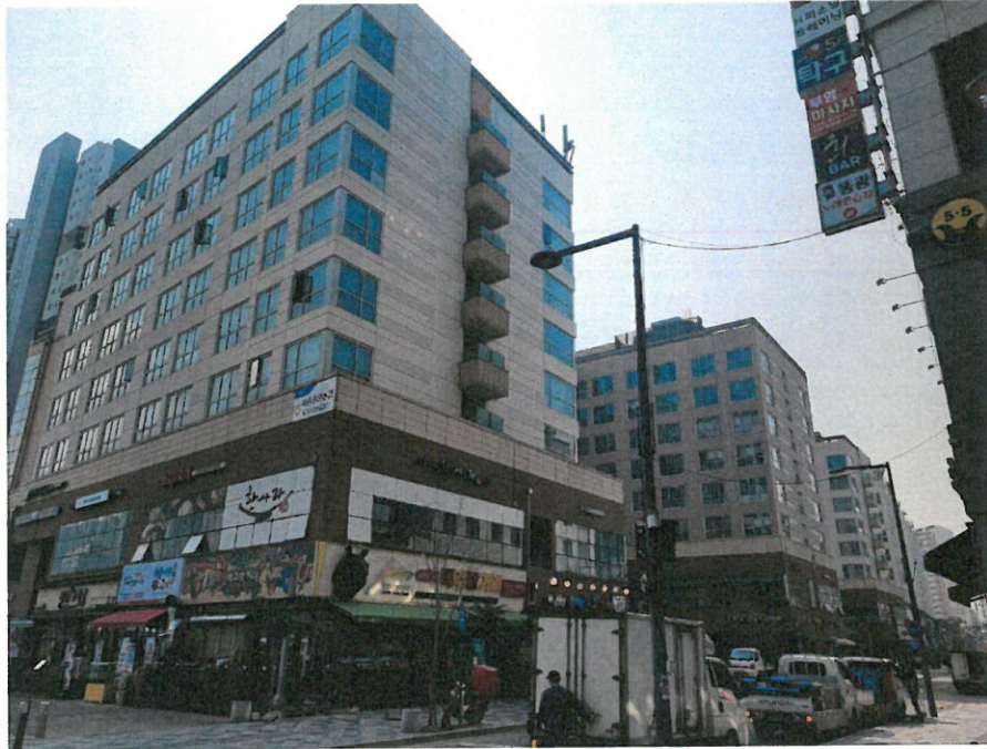
본 단지 전경