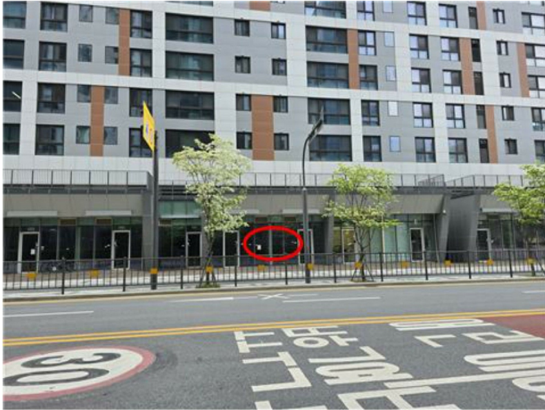
[본 건 모습]