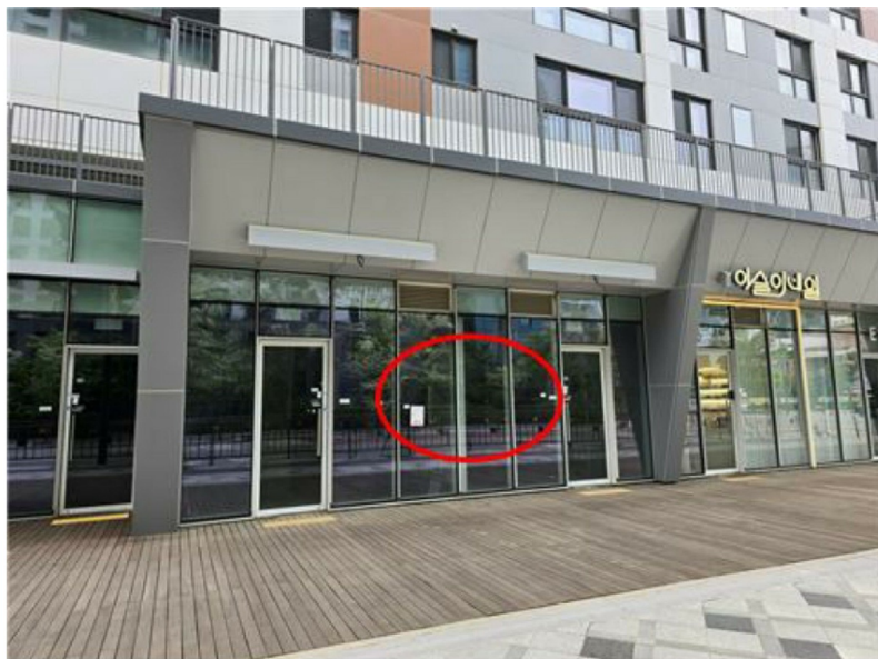
[본 건 모습]