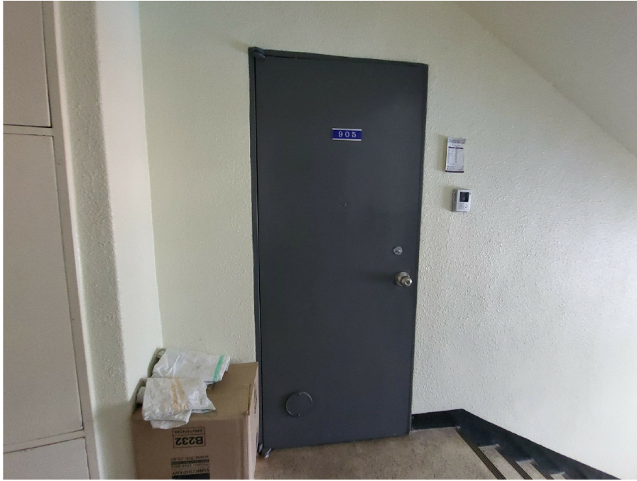
[ ( 9 905 ) ]