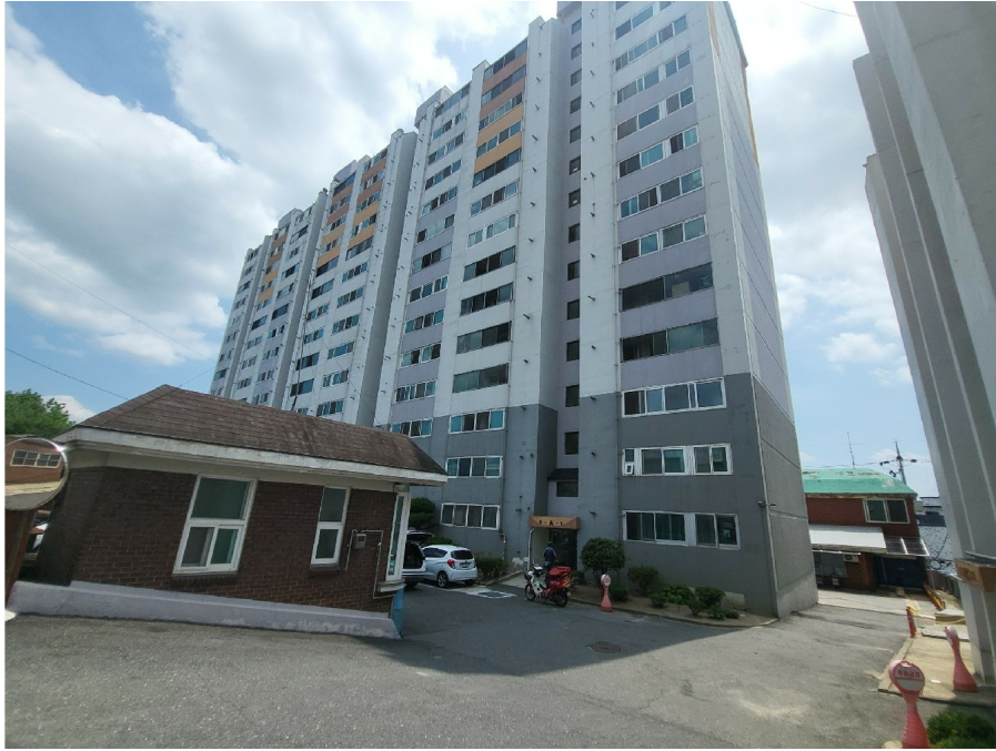
[ ( ) ]