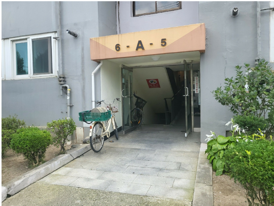
[ 1 ]