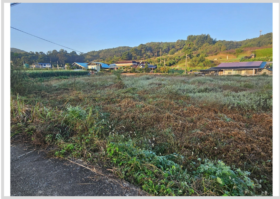
1,2 ( )