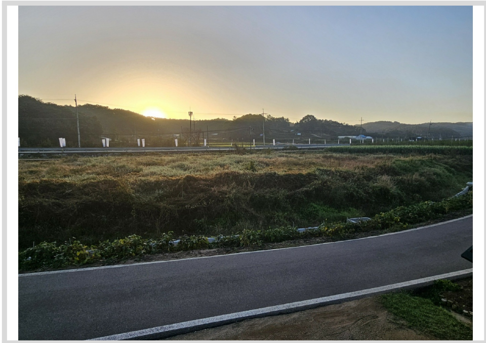
1,2 ( )