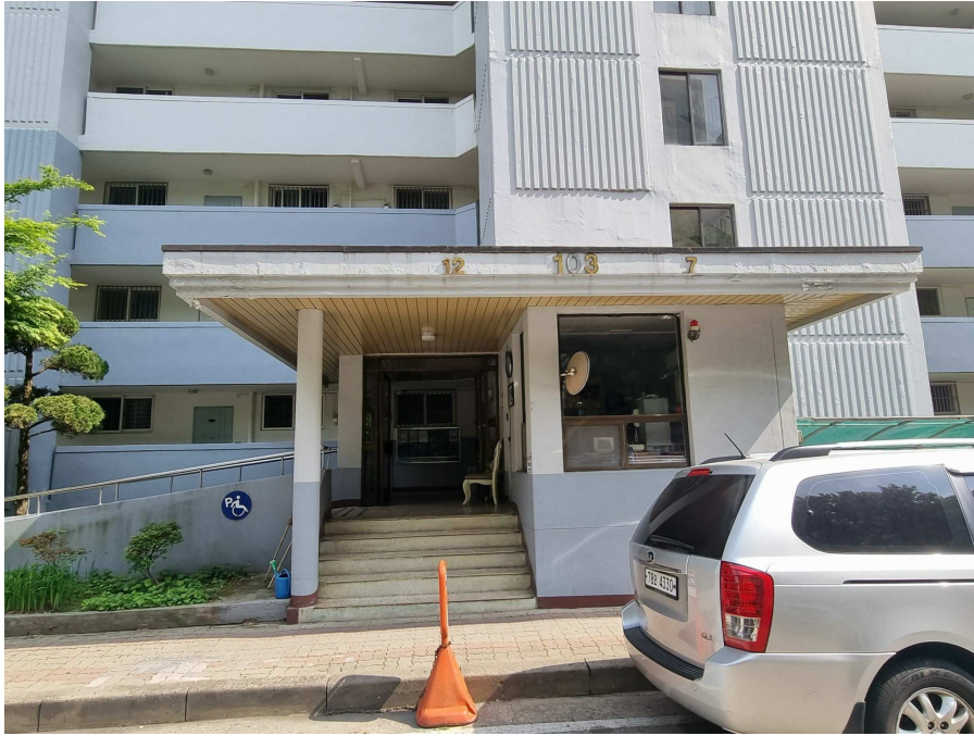
1층 공동 출입문