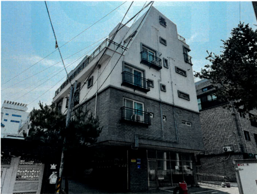
본건 서측 전경