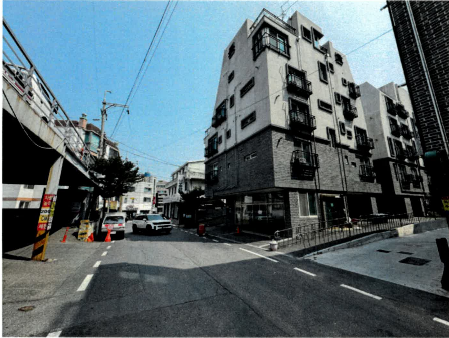
본건 남서측 전경 및 접면도로