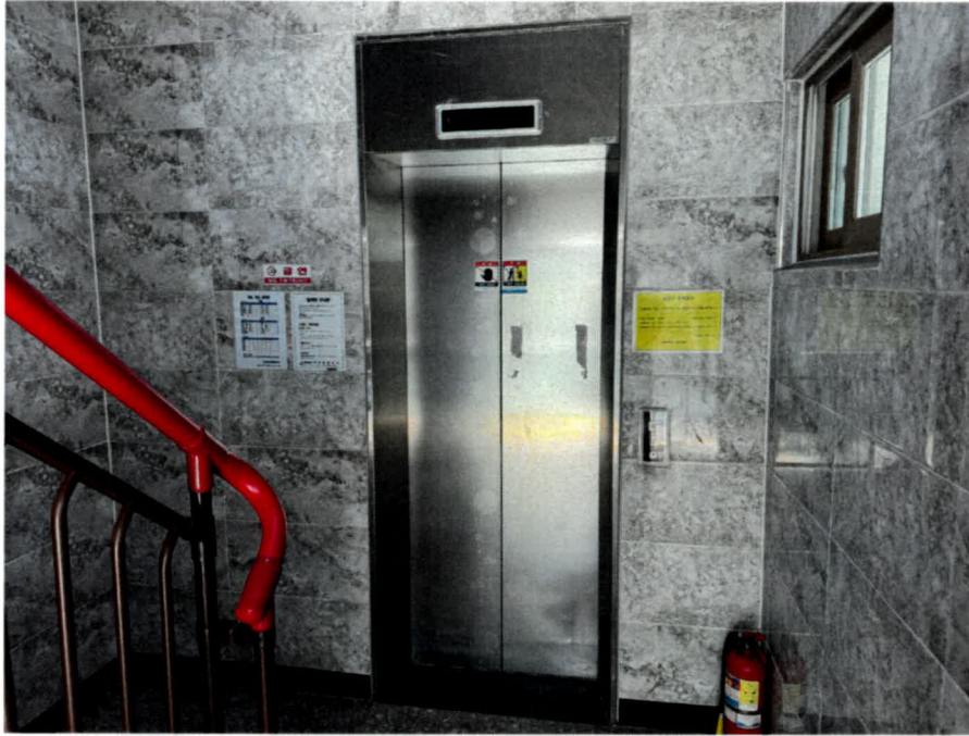
1층 계단실 승강기