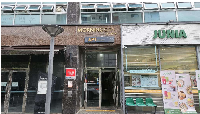
모닝시티 1층 아파트 주출입구