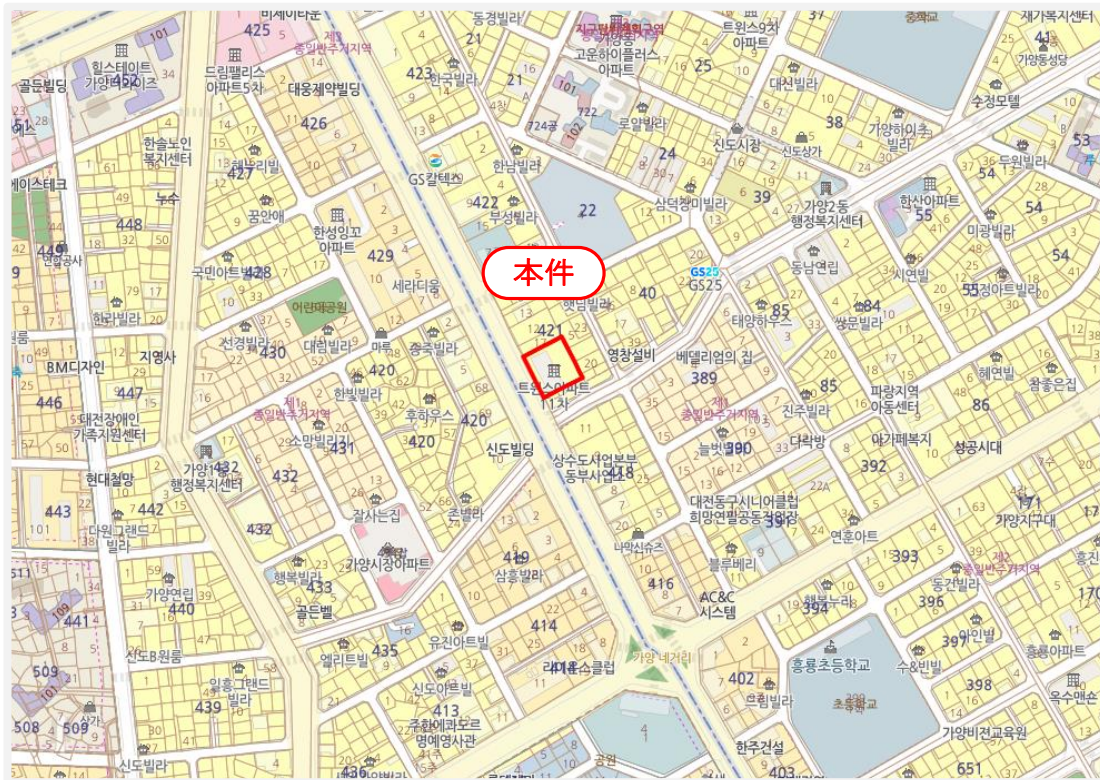
[ 호별배치도 ]

대전광역시 동구 가양동 421-11 (트윈스아파트11차 제1층 제비102호)