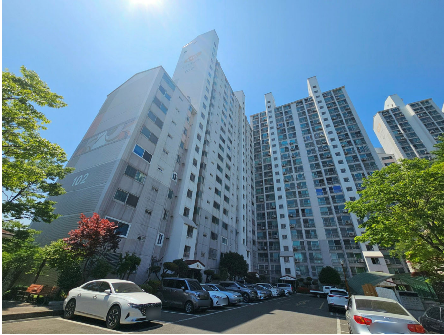
본건동 전경(북동측에서 촬영)