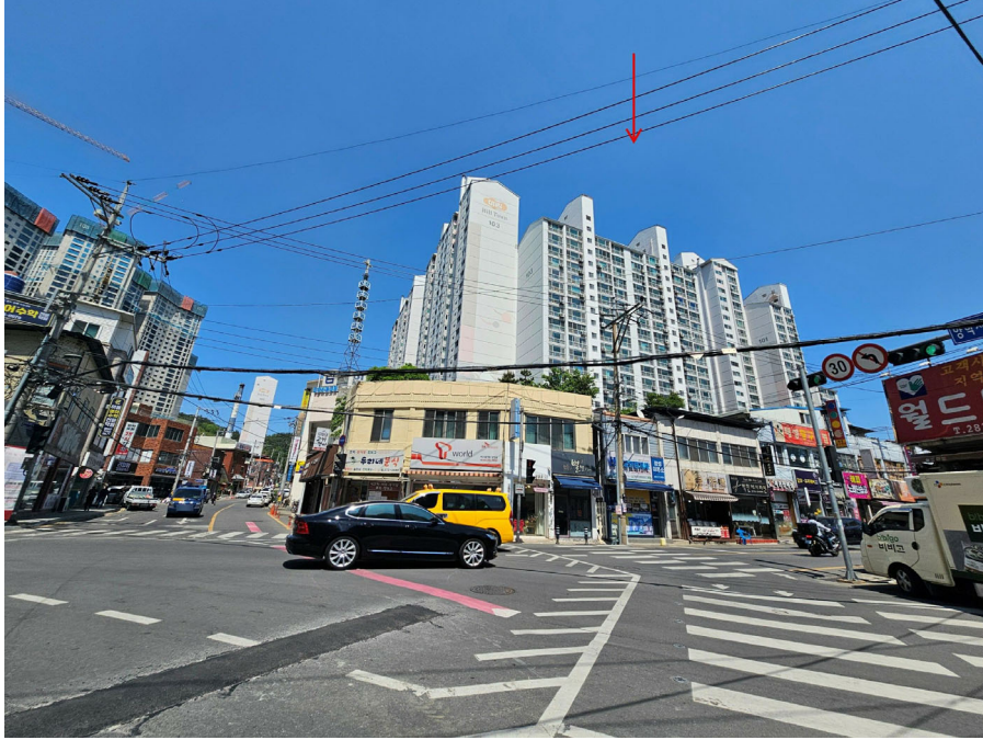
단지 주위환경(남서측에서 촬영)