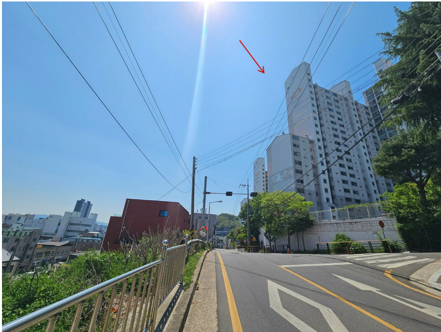
단지 주위환경(북동측에서 촬영)