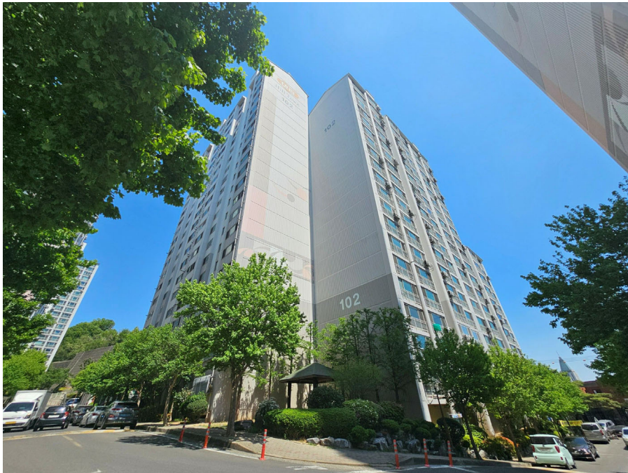
본건동 전경(남서측에서 촬영)