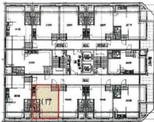
<대전광역시 유성구 봉명동 656-8 이신팰리스 제3층 호별배치도>