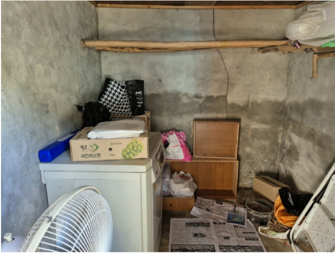
( ( ) )