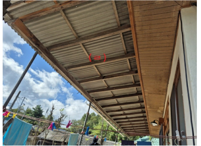
( ( ) )