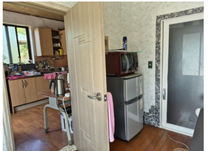
( 2 )