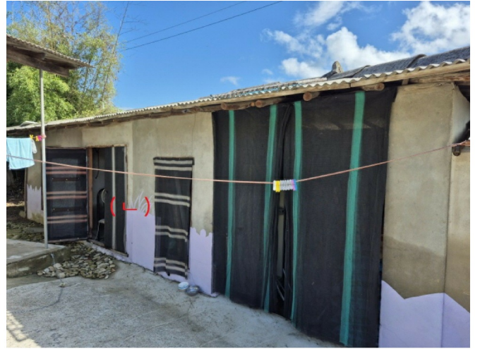
( ( ) )