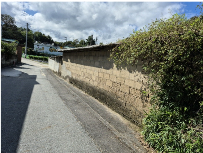
( 1 )