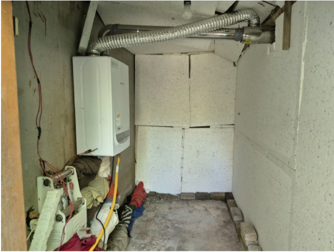
( ( ) )