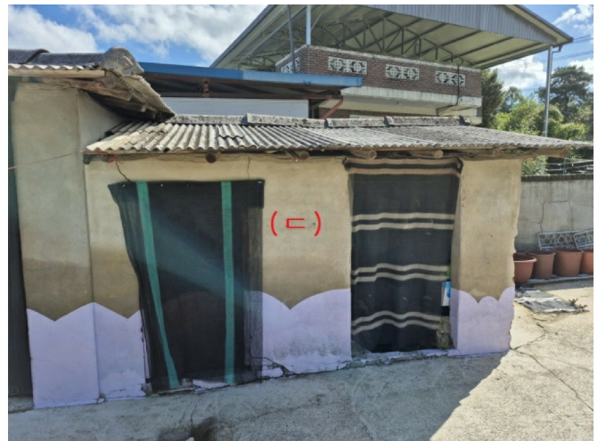
( ( ) )