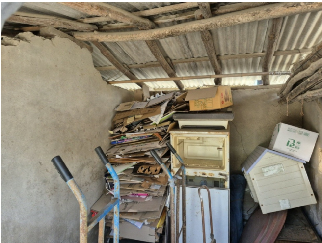
( ( ) )