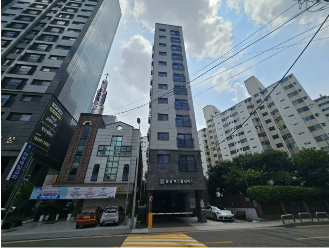
본건 소재 건물 전경