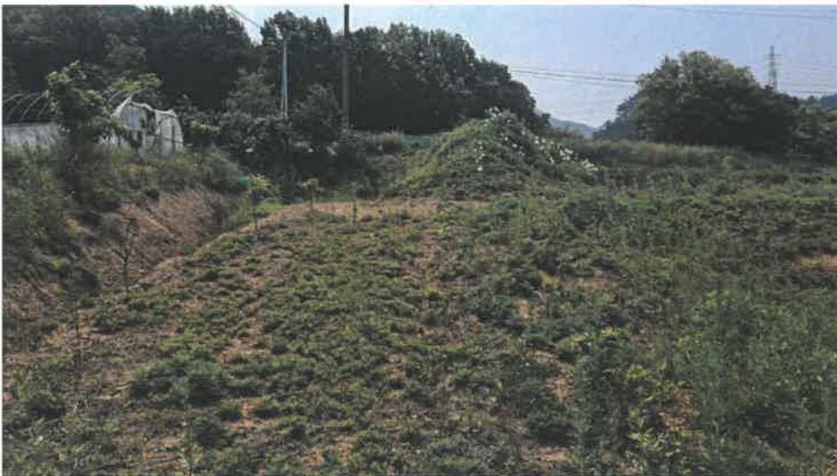
본건 전경( 현황 전 )