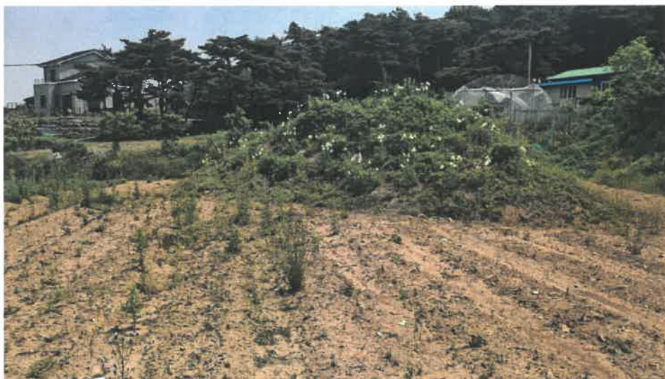
본건 전경(분묘 형태로 보이거나 흙덩이로 탐문조사됨)