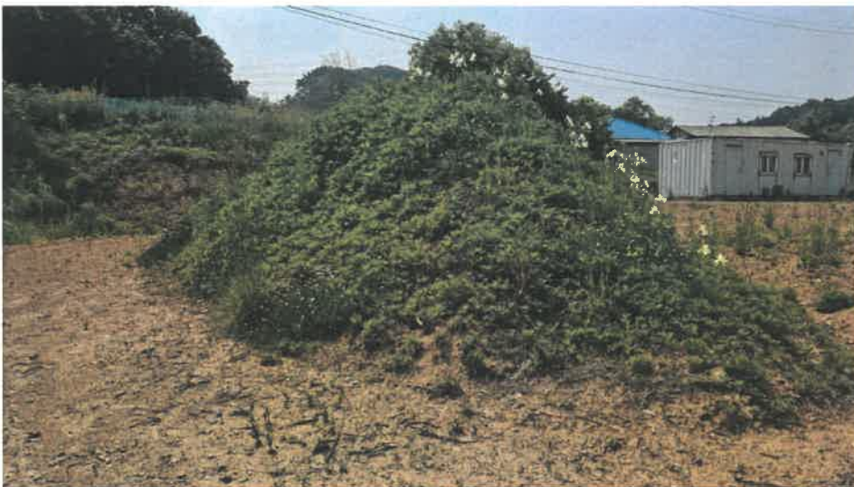
본건 토지전경(인근 주민 탐문 결과 분묘가 아닌 흙덩이로 조사됨)