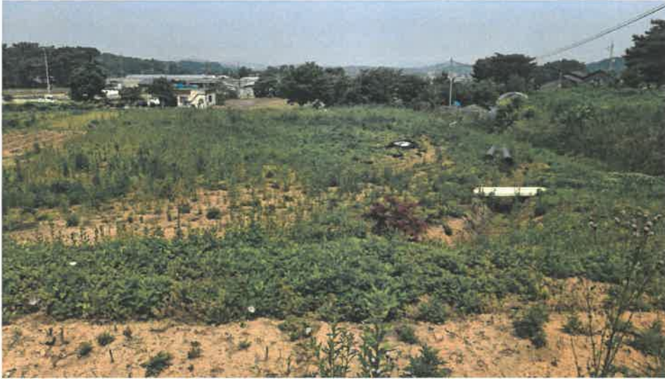
본건 전경( 현황 전 )