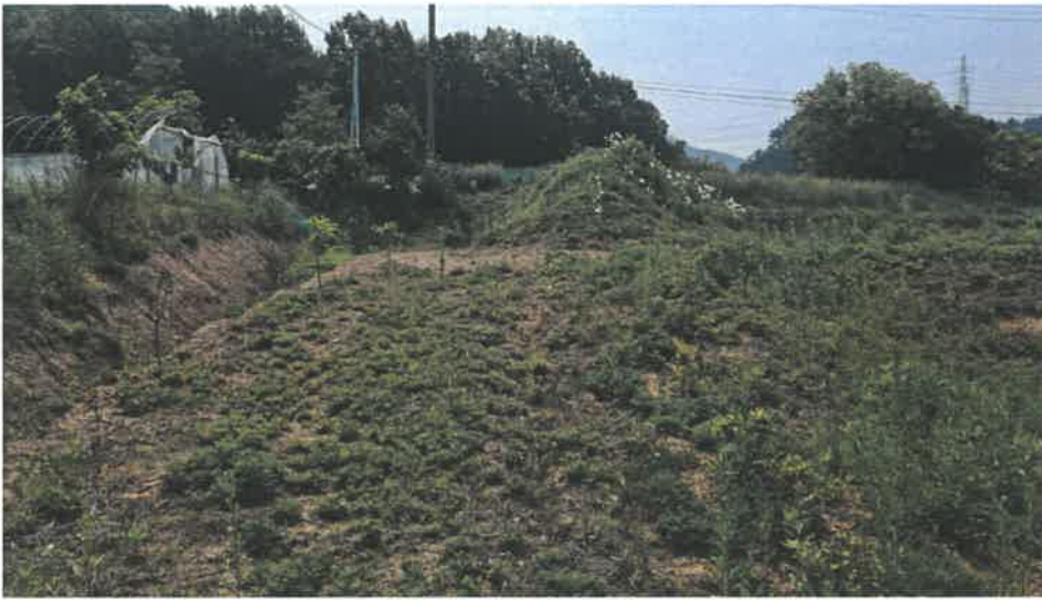
본건 전경(현황 전)