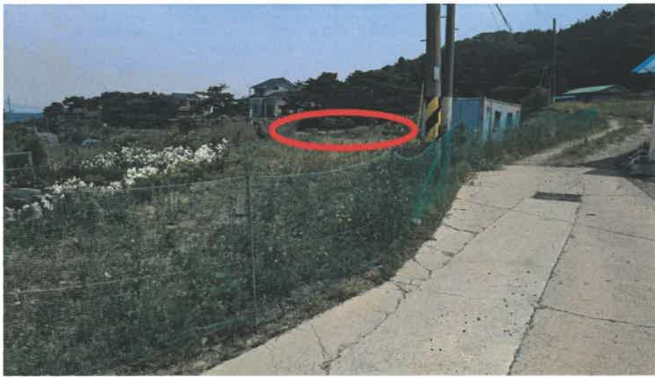
본건 전경 및 도로부분