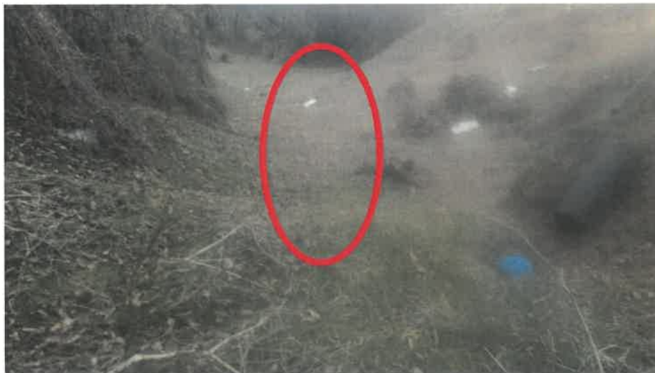
본건 전경(휴경지 전) : 부정형 완경사