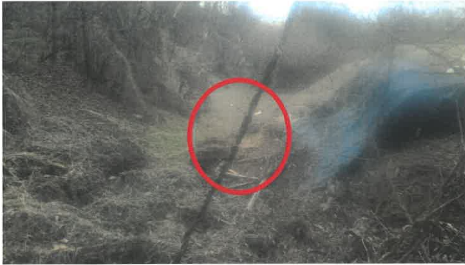
본건 전경(휴경지 전)