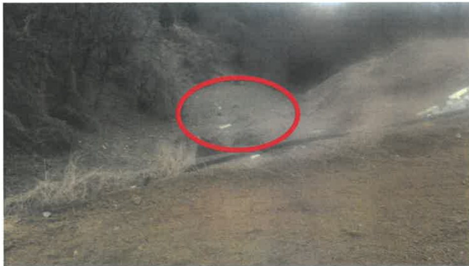
본건 전경(휴경지 전) : 주위는 자연림, 농가주택 소재