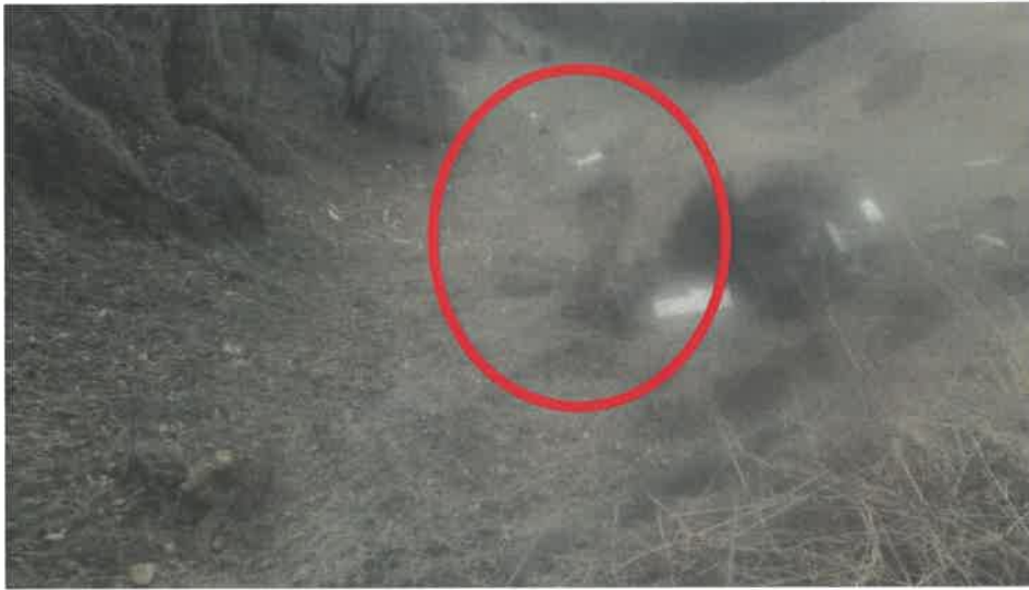
본건 전경( 휴경지 전) : 부정형 완경사