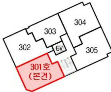
[케이엠아트빌 제3층 호별배치도]