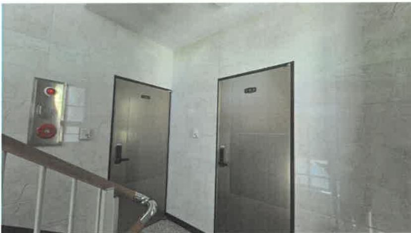
기호(2) 3층 전경