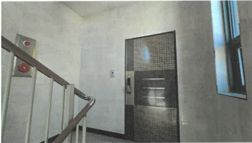
기호(2) 4층 전경