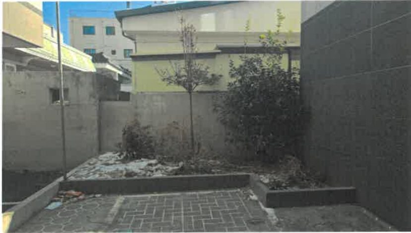
본건 일부(화단 등) 전경