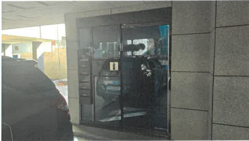
기호(2) 1층 계단실 출입구 전경