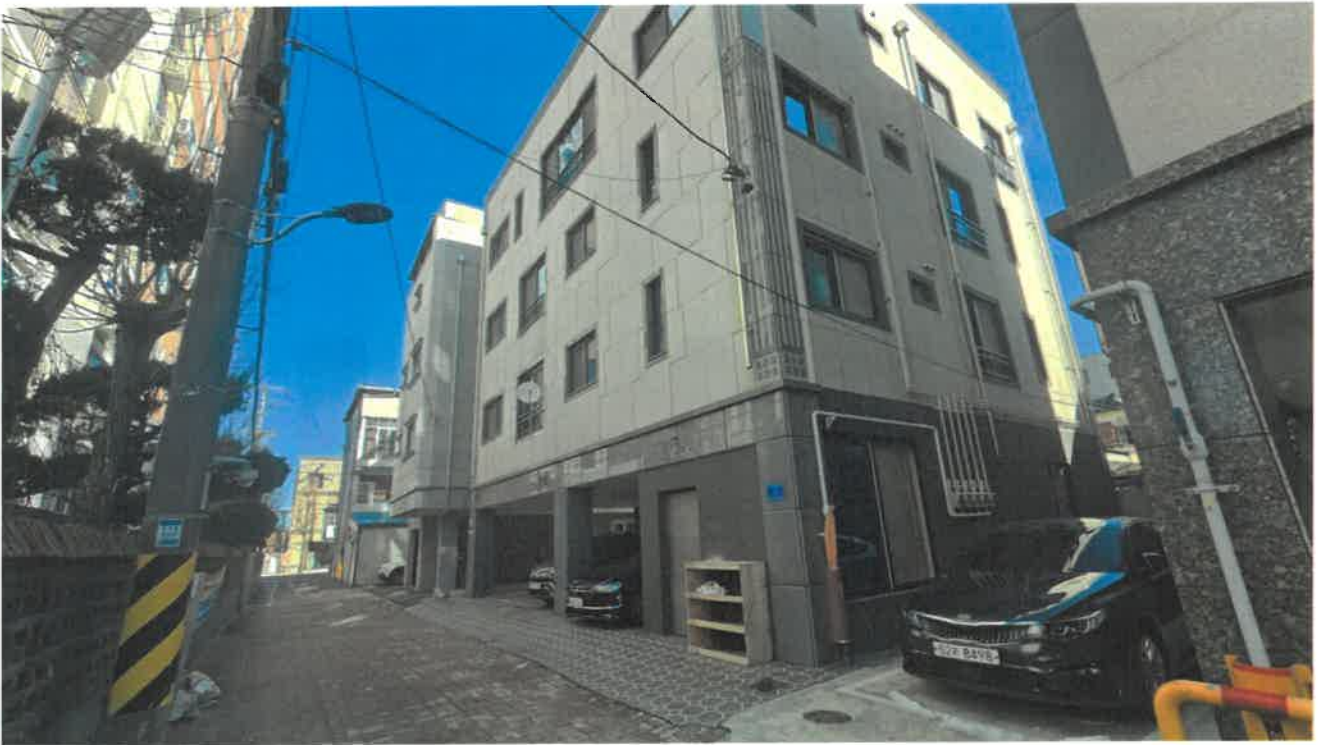
본건(1,2) 및 주위 전경