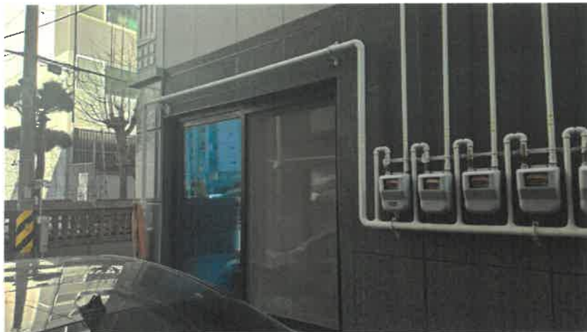
기호(2) 1층 근린생활시설 전경