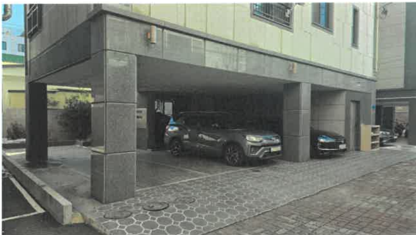
본건 일부(필로티주차장 등) 전경