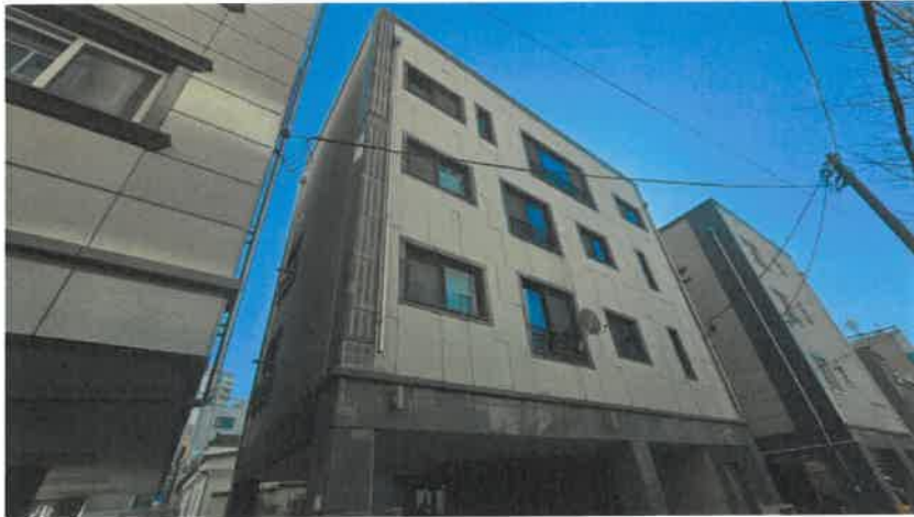
본건 일부 전경