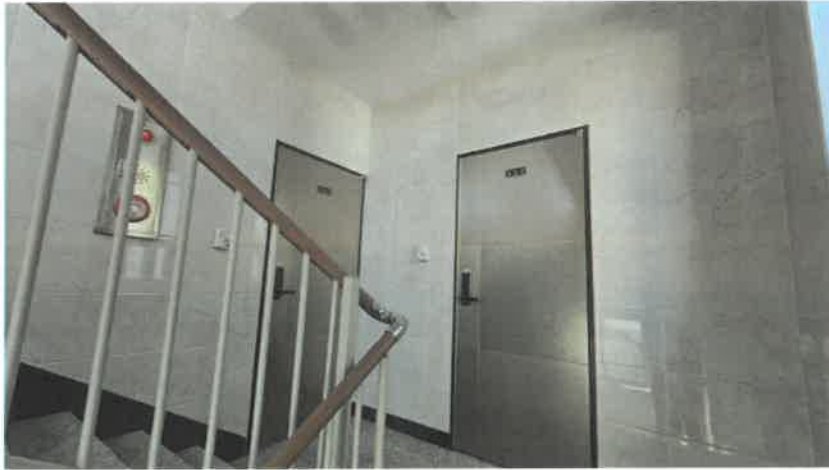
기호(2) 2층 전경