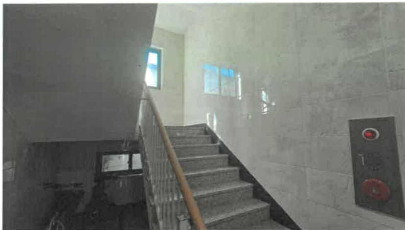
기호(2) 1층 계단실 전경