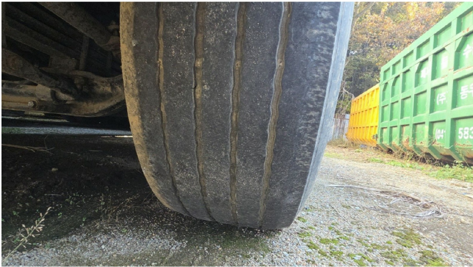
( -1 )