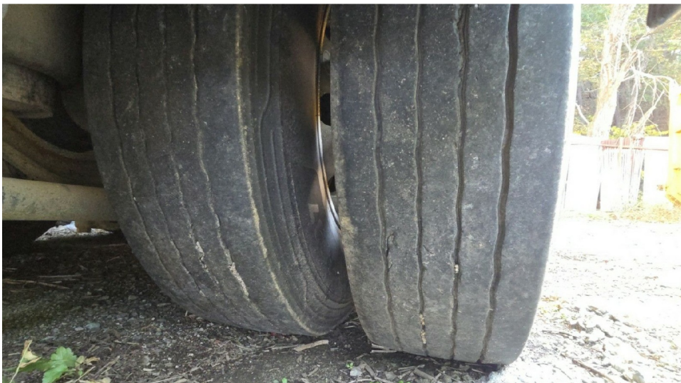
( -2 )