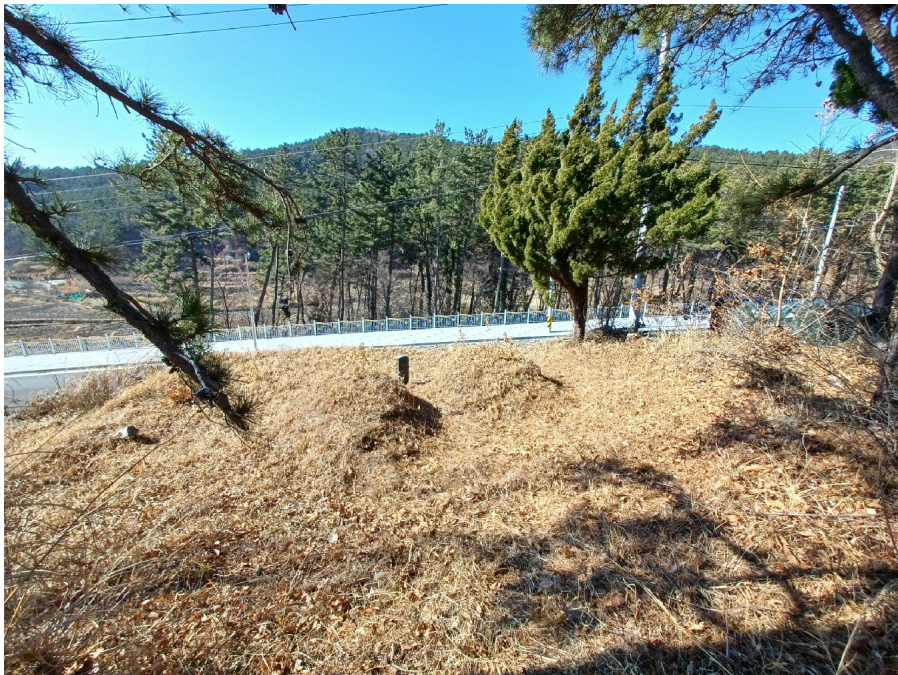
( 318-1, )