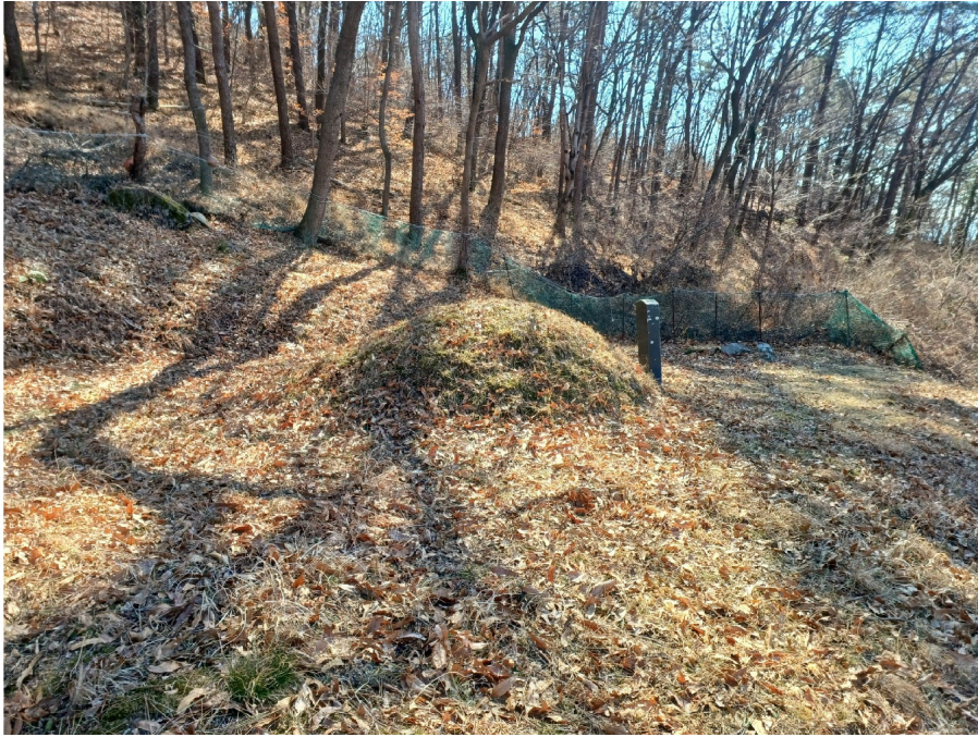
( 323, )