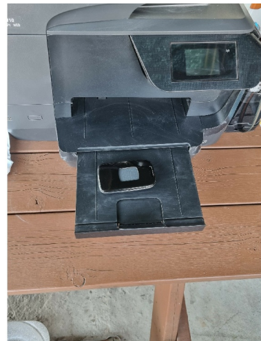
[ ( ) ]