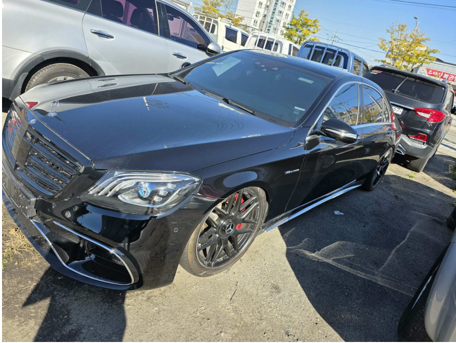
본건 측면 전경