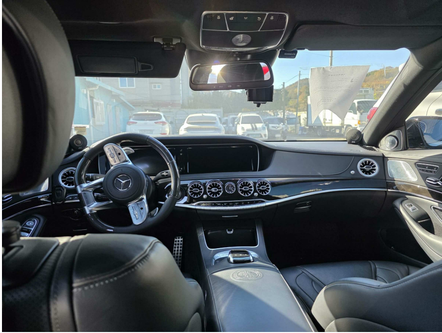
본건 운전석 전경