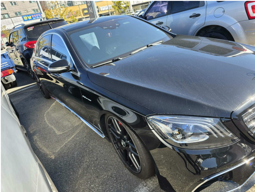
본건 측면 전경