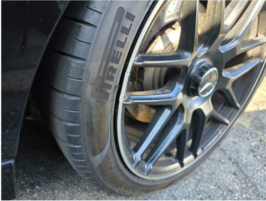
본건 타이어 전경