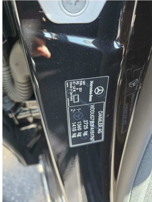
본건 차대번호 전경