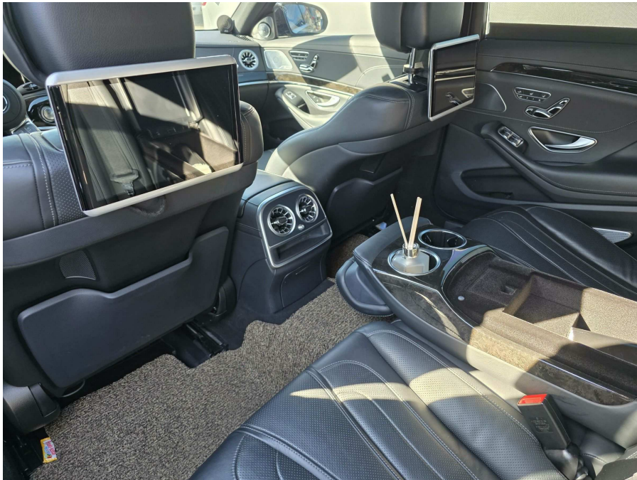
본건 뒷자석 전경