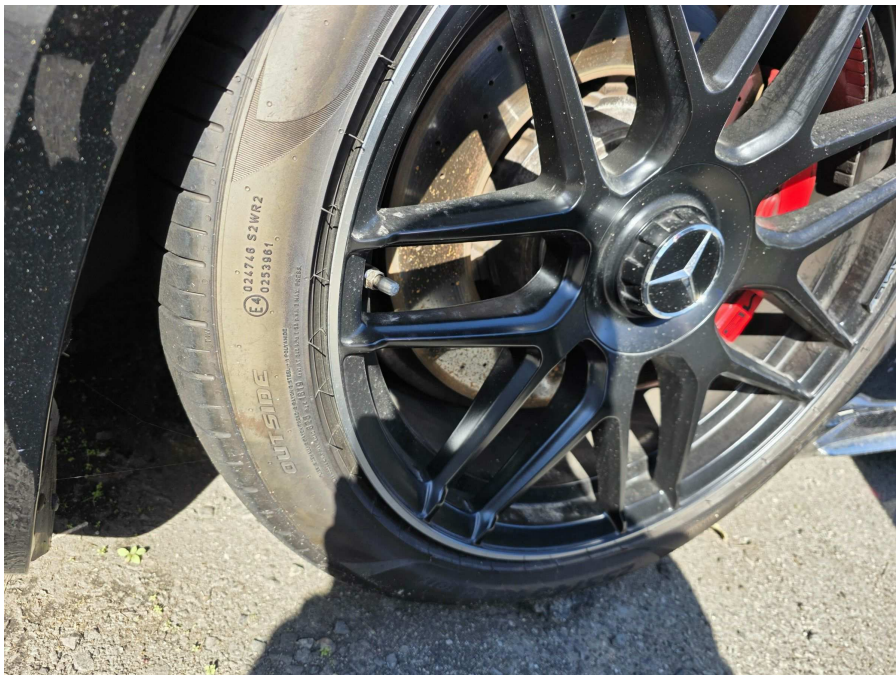
본건 타이어 전경