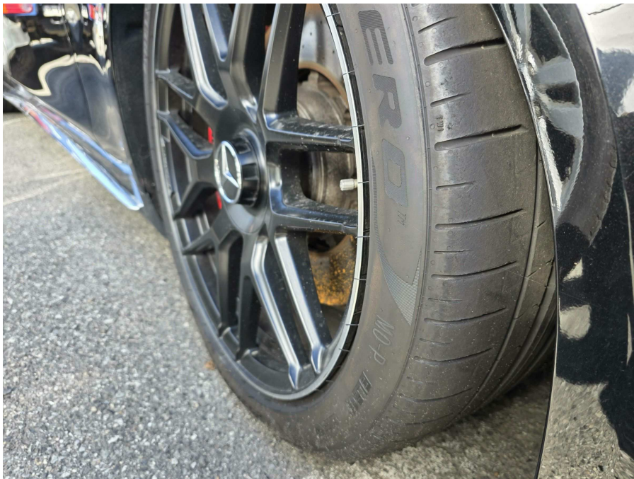
본건 타이어 전경