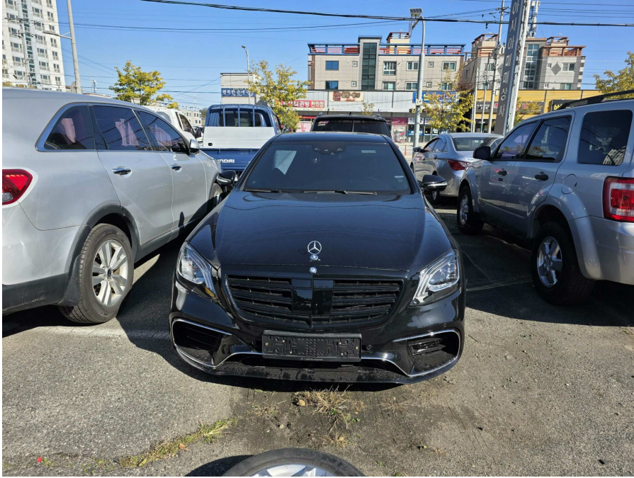
본건 전면 전경