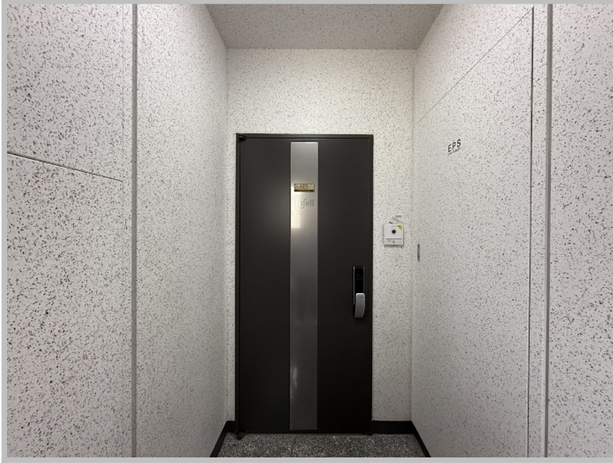
【 본건 현관 】