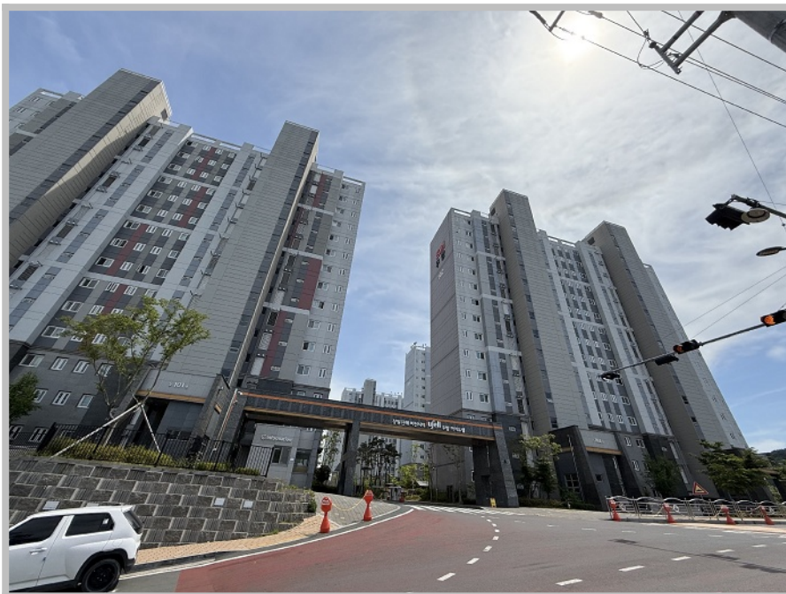
【 본건 단지 전경 】