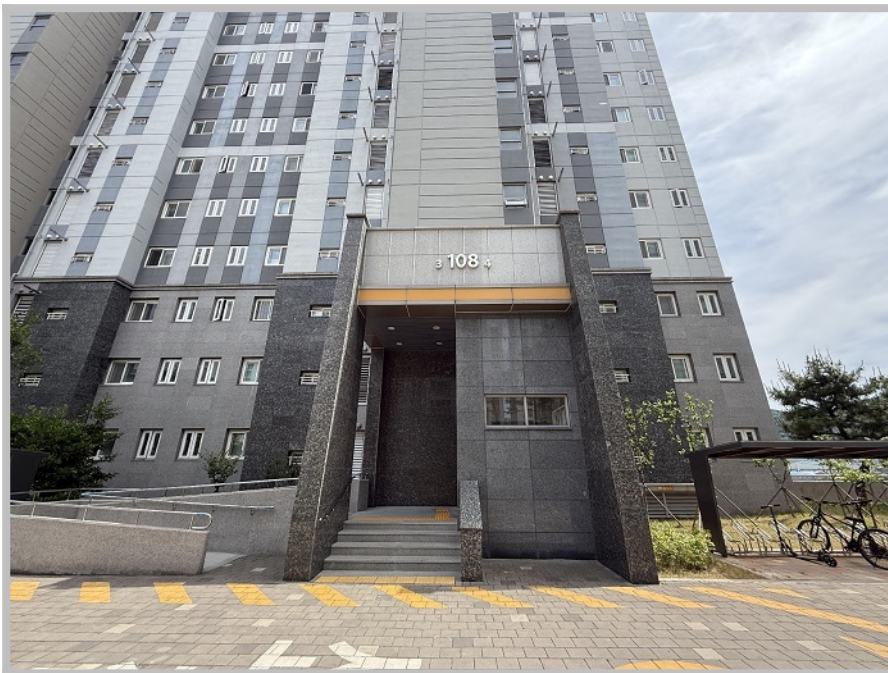
【 본건 공동현관 】