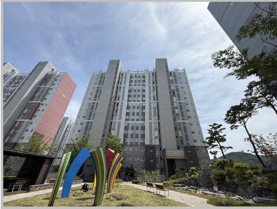
【 본건 전경 】