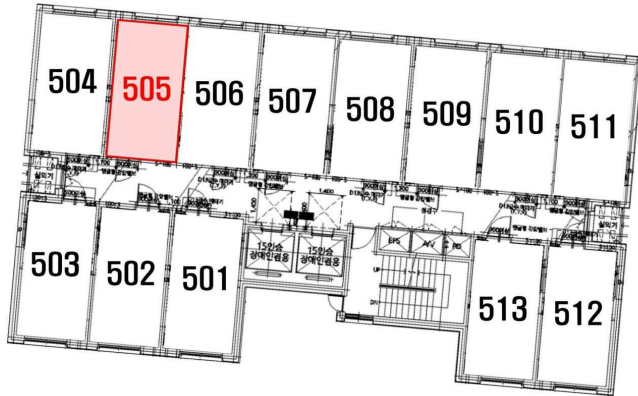
< 호별배치도 >