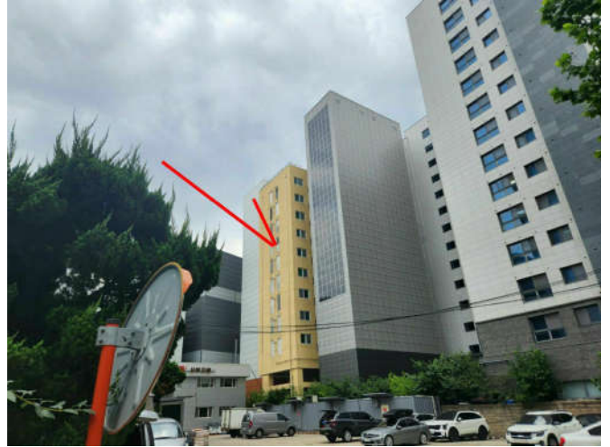
대상물건 소재 건물