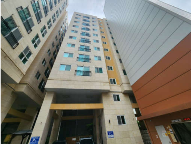
대상물건 소재 건물