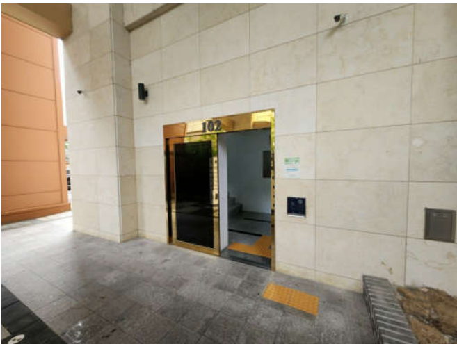
대상물건 소재 건물(102동) 공동 출입구