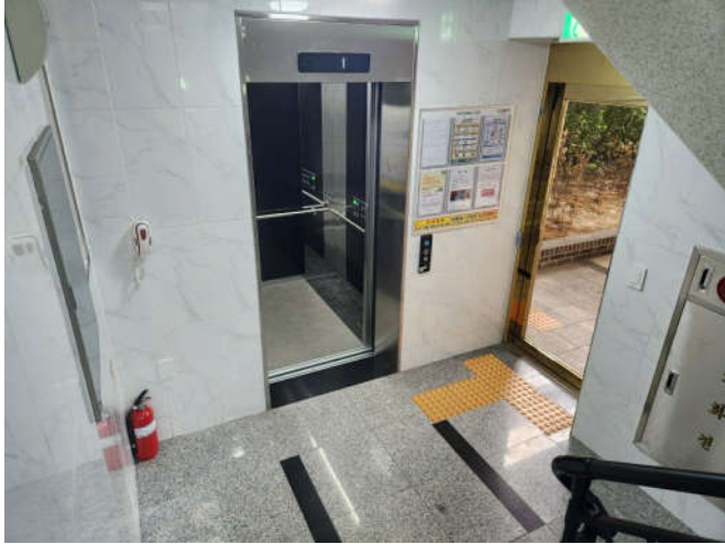
1층 계단실 및 승강기