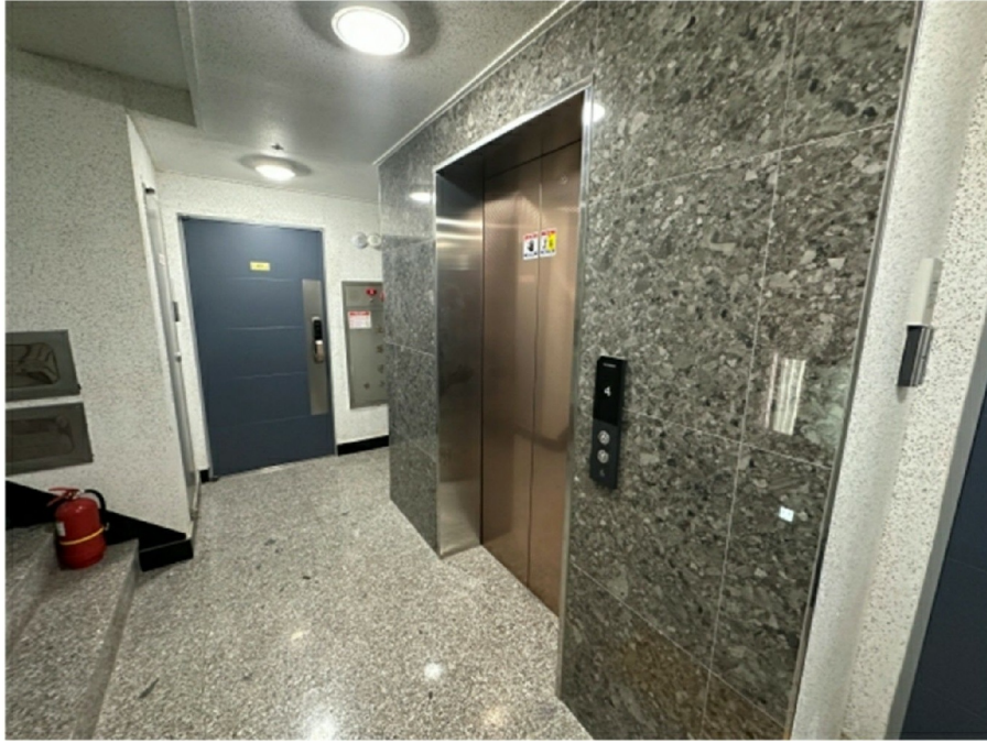
(102 ) 4