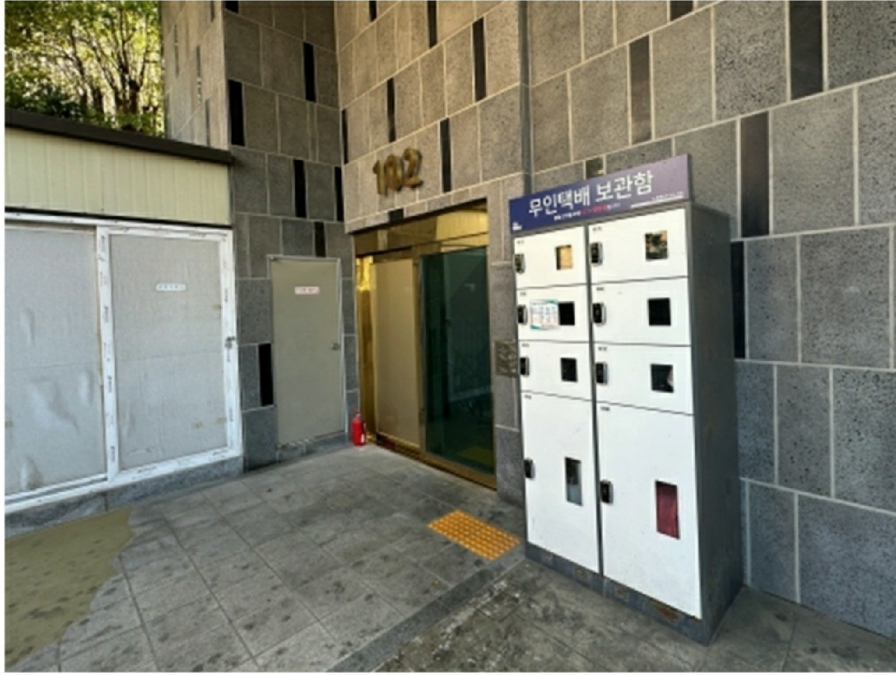
(102 ) 1