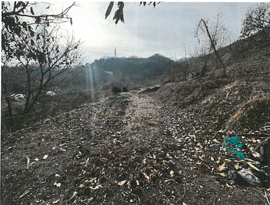
본건 북측 전경