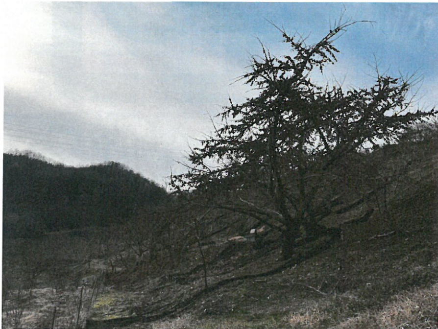
본건 소재 타인소유 제시외수목