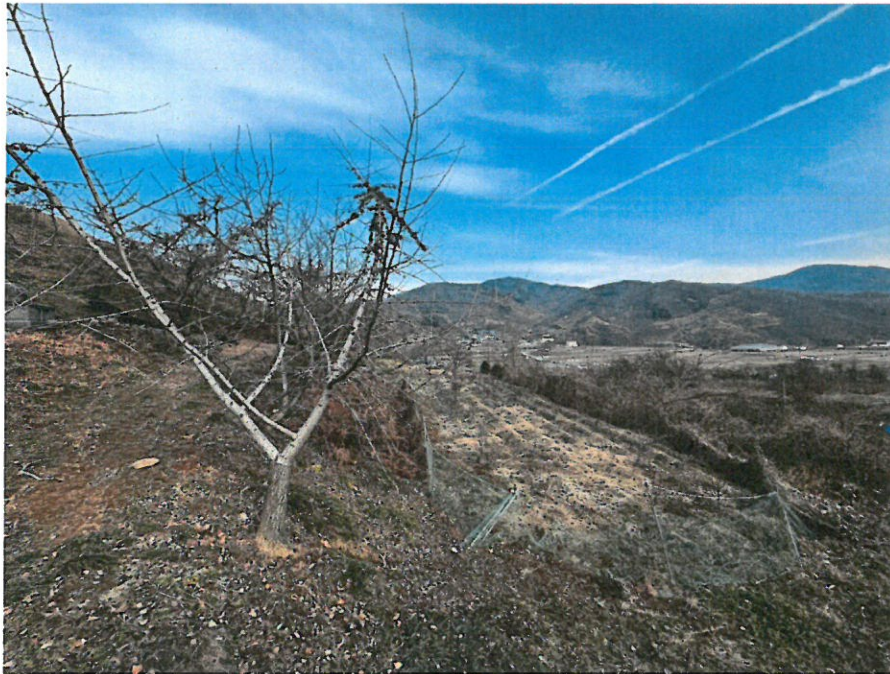
본건 남측 전경 및 타인소유 제시외수목