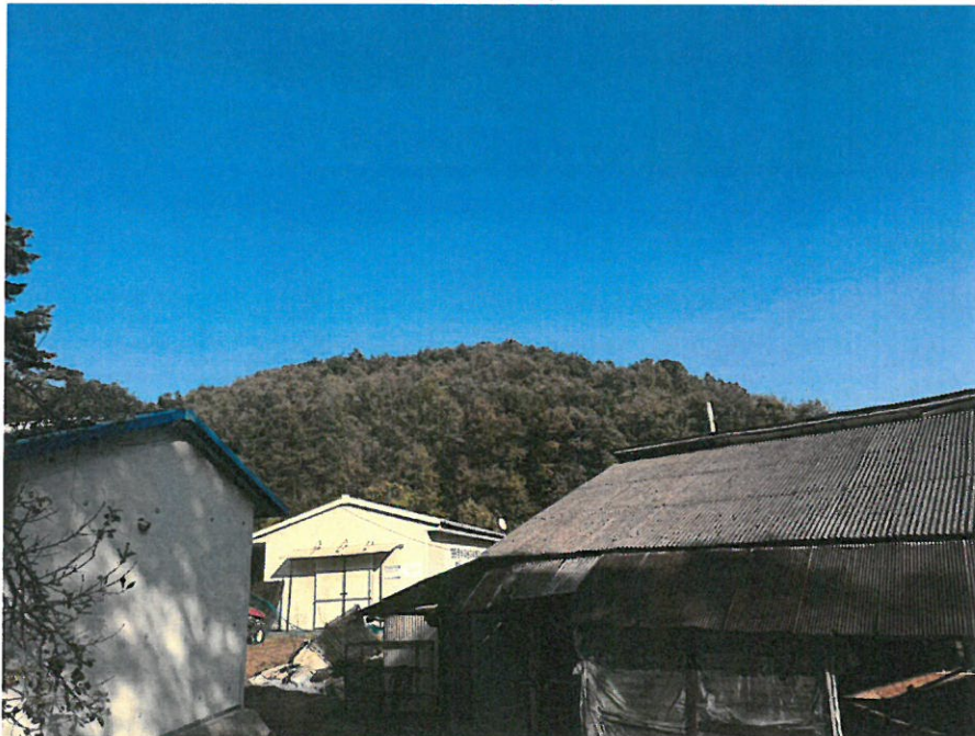
본건 남동측 전경