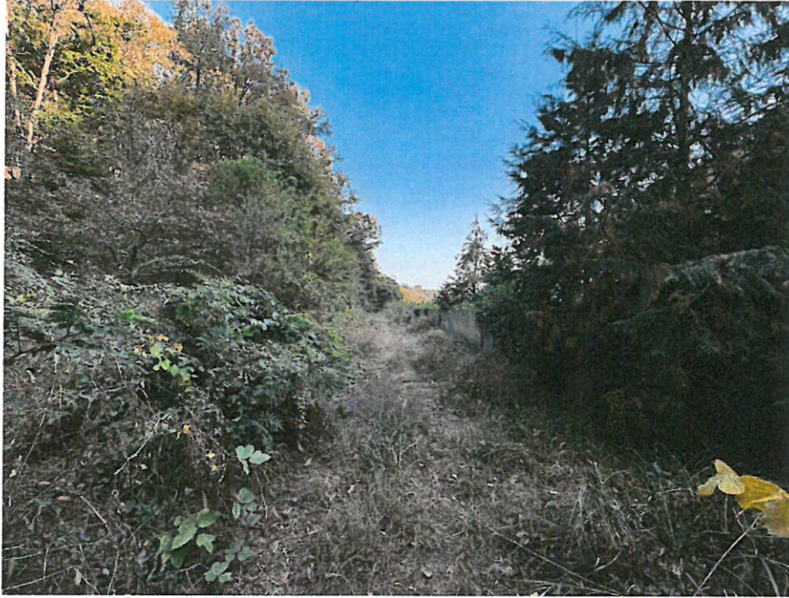
본건 일부 임도