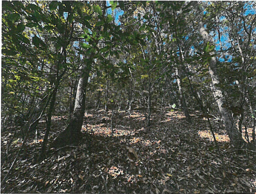
본건 내부 전경