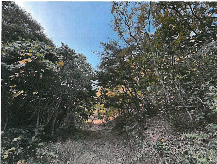
본건 내부 전경