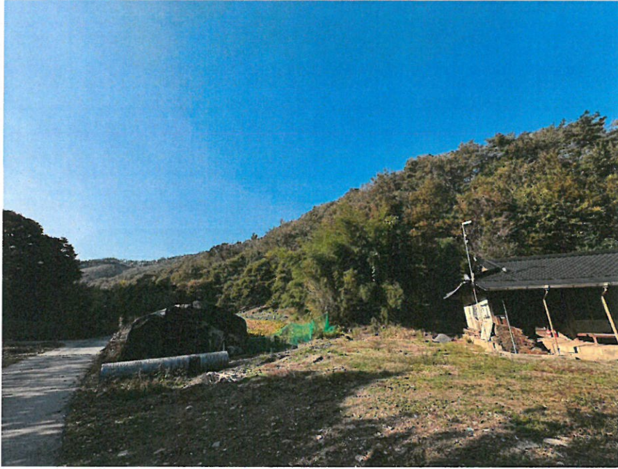
본건 남서측 전경