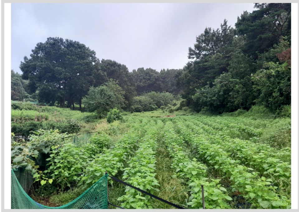
2 ( )