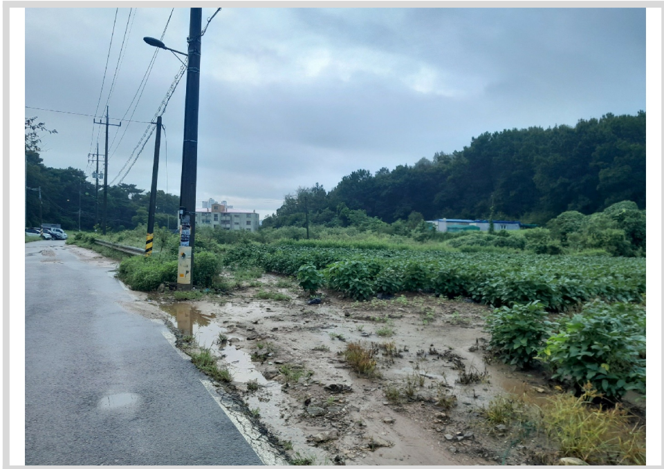
1 ( )