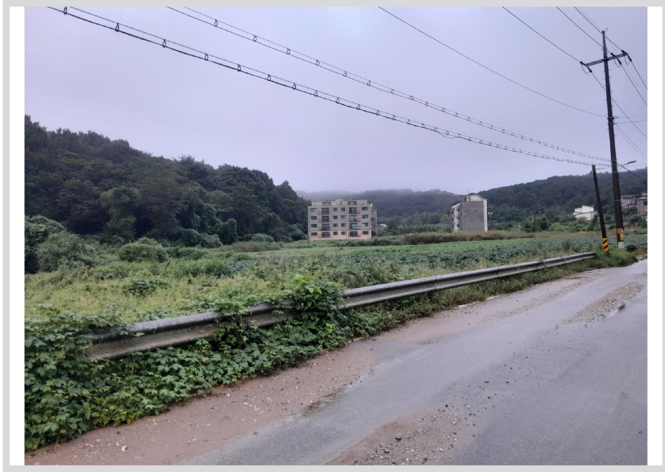
1 ( )