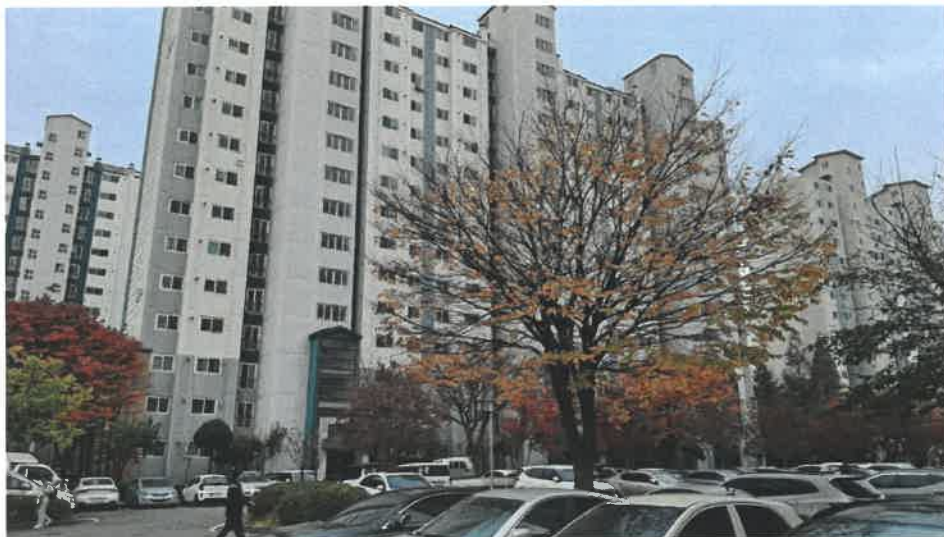
본건 전경(북동측 인근에서 촬영)