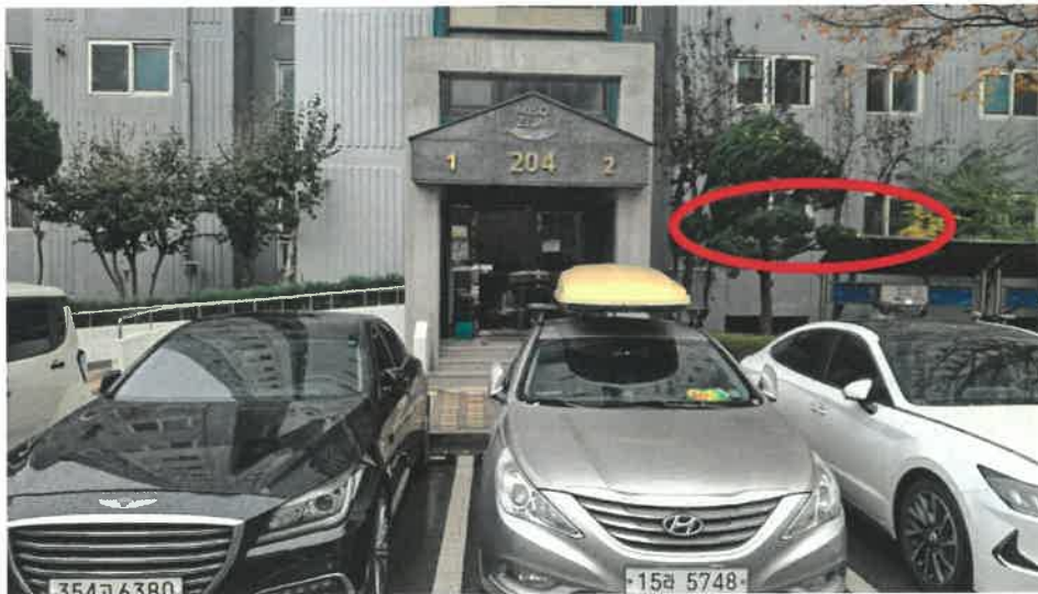
본건 전경(출입구 및 본건 아파트)