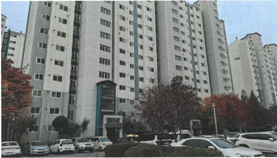
본건 전경(북동측 인근에서 촬영)