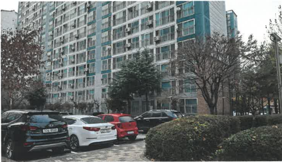
본건 전경(남동측 인근에서 촬영)