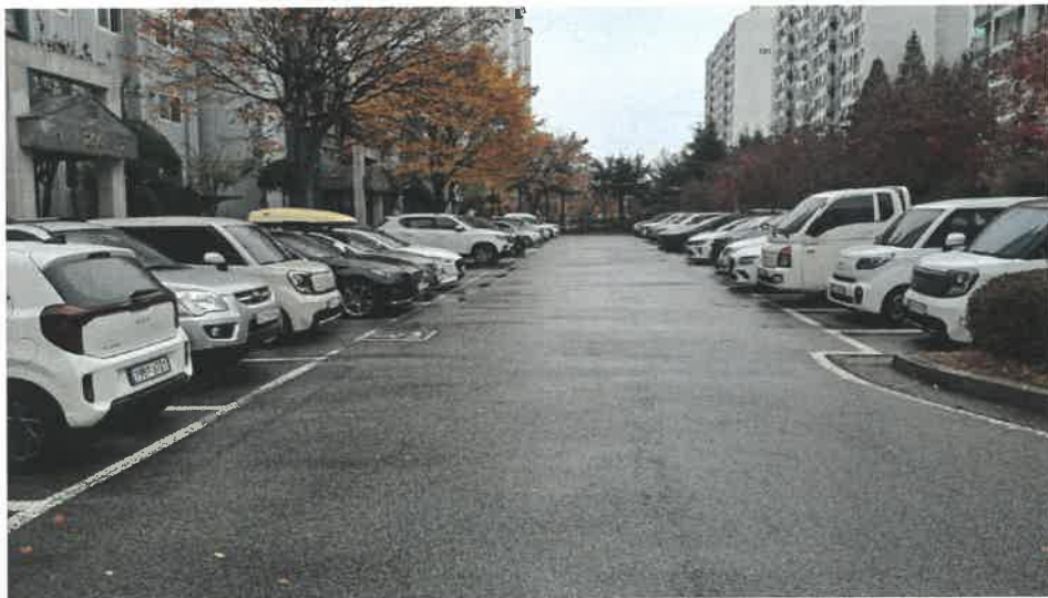
단지내 지상 주차장