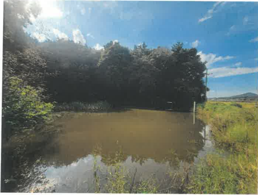
본건- 북동측에서 촬영