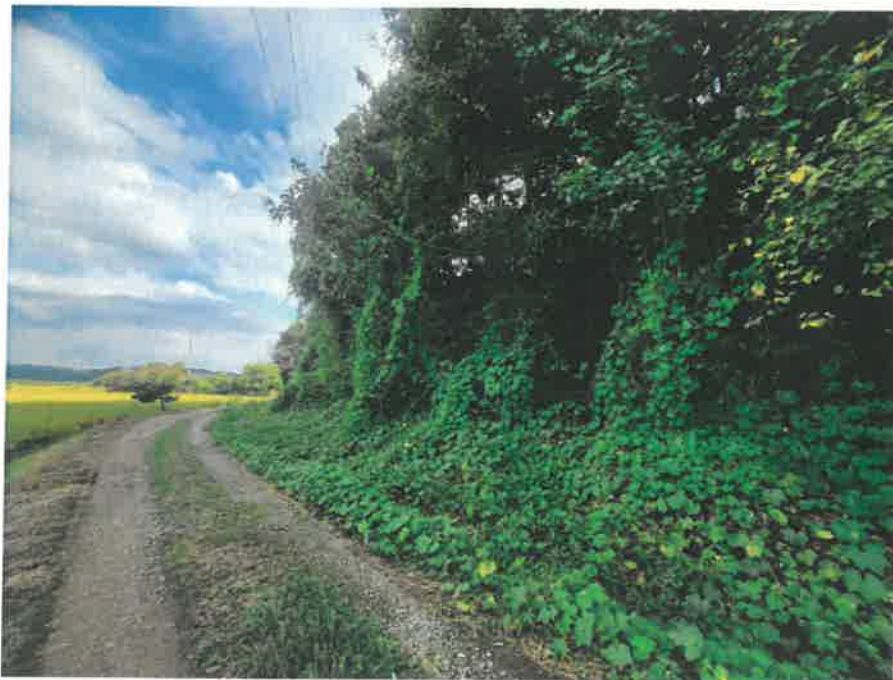
본건 전경- 북서측에서 촬영