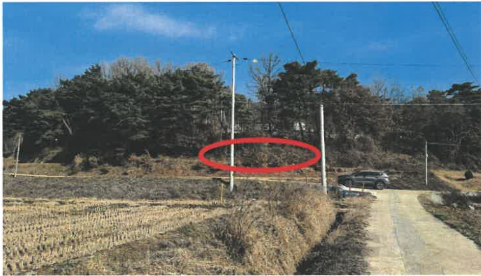
본건 전경(남서측 인근에서 촬영)