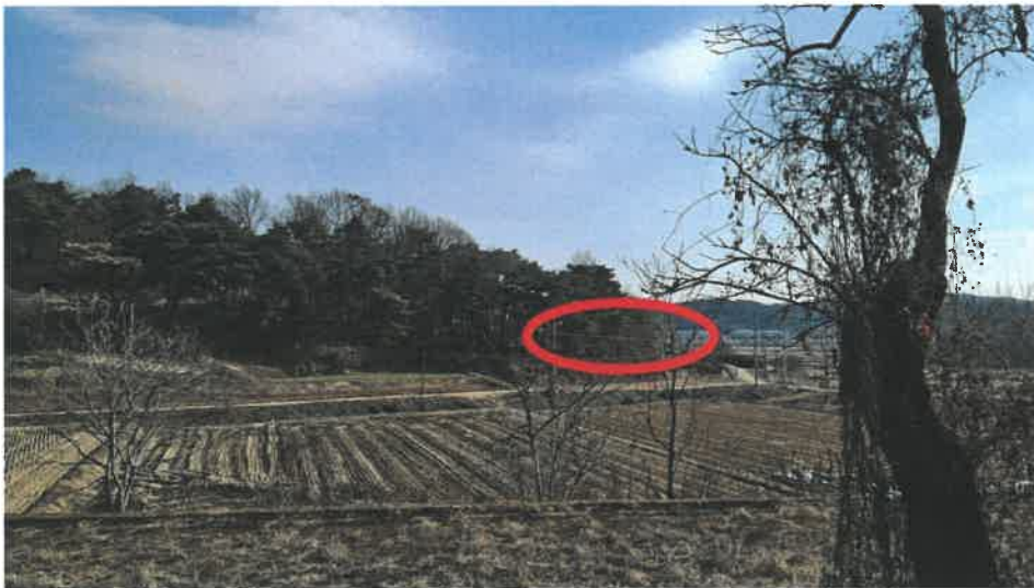
본건 전경(서측 근거리에서 촬영)