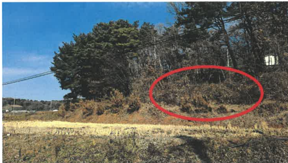
본건전경(남서측 인근에서 촬영)