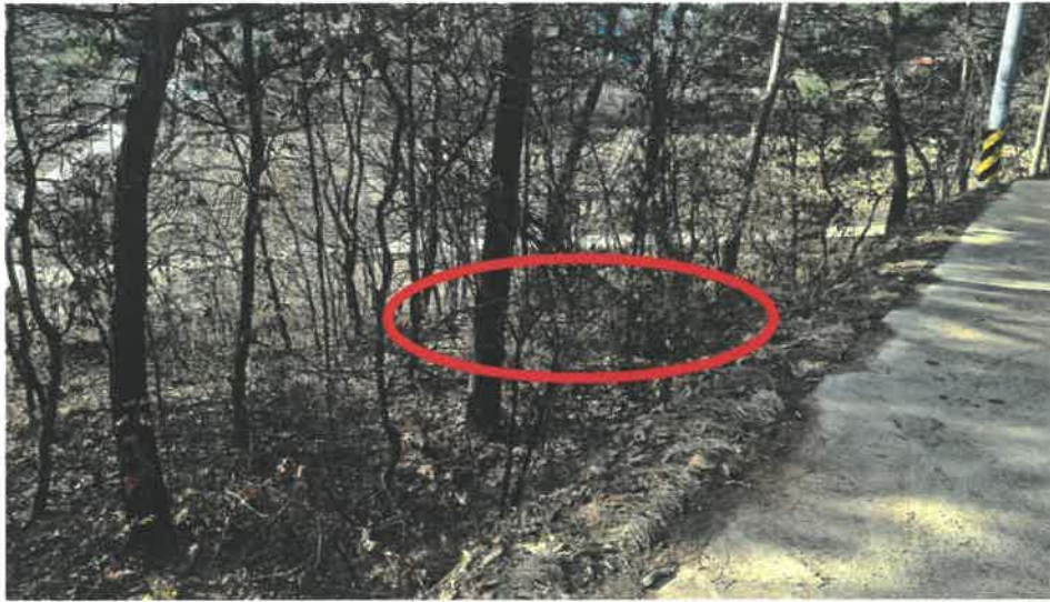
본건 전경(북동측 도로변에서 촬영)