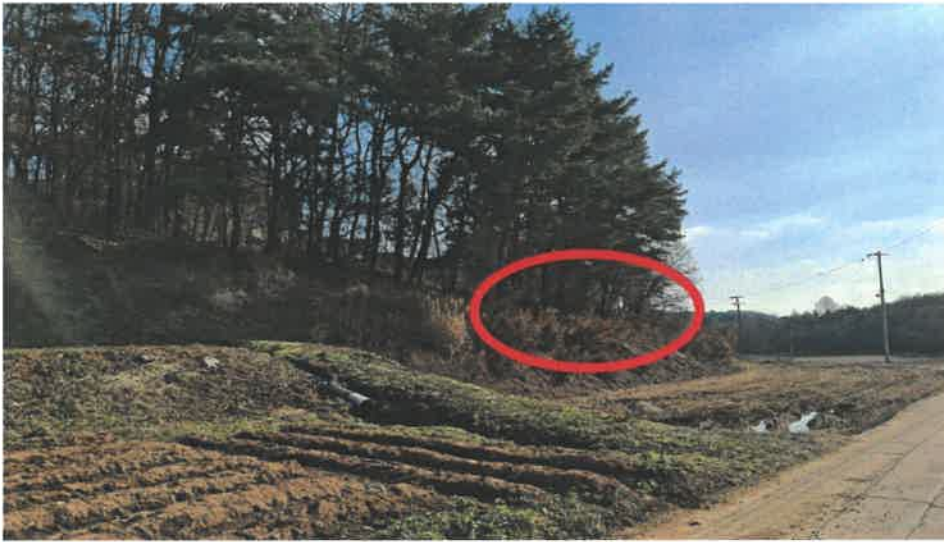
본건 전경(북서측 인근에서 촬영)