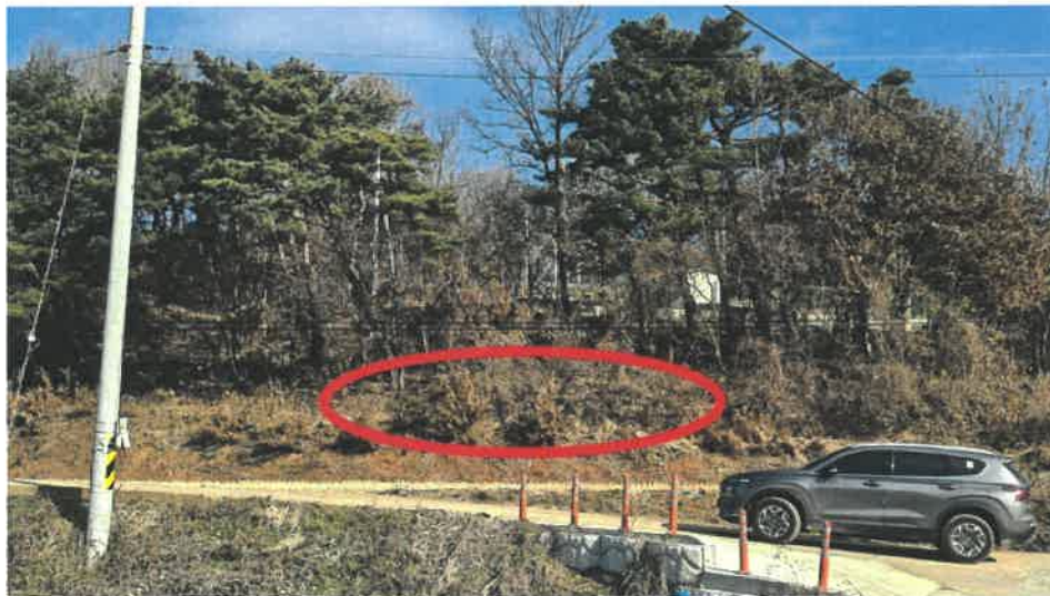
본건 전경(남서측 인근에서 촬영)