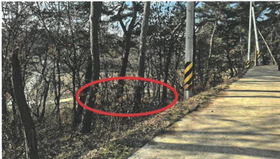
본건 전경(북동측 도로변에서 촬영)