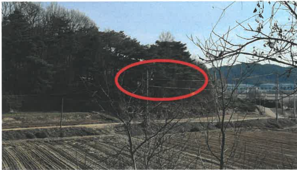
본건 전경(서측 인근에서 촬영)