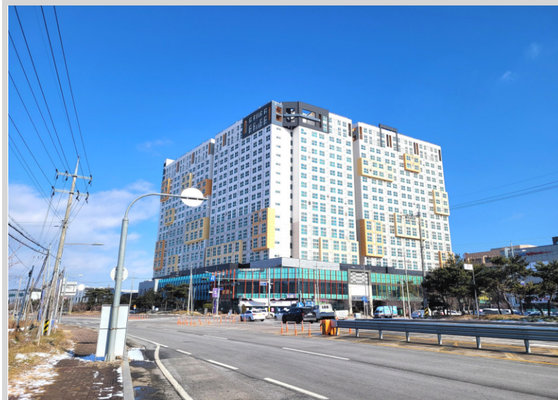
[본건 및 주변환경]