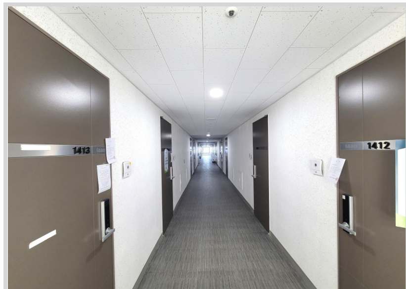
[14층 A 복도]