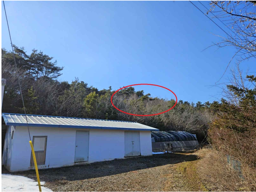
본건 전경 (남동측 촬영)