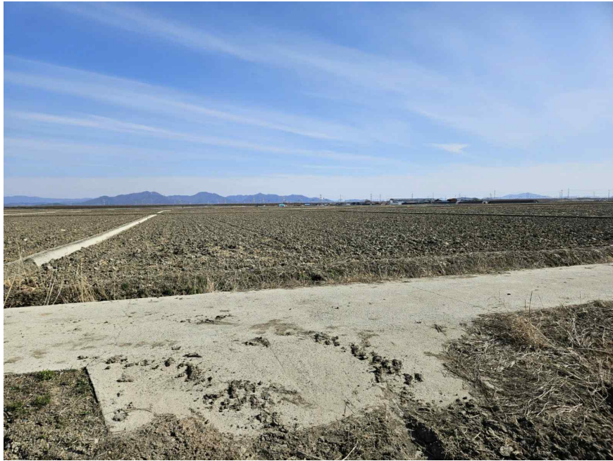
본건 전경 (북서측 촬영)