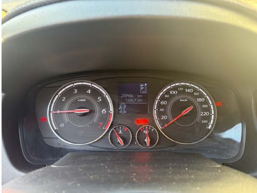
[ 본건 계기판 ]