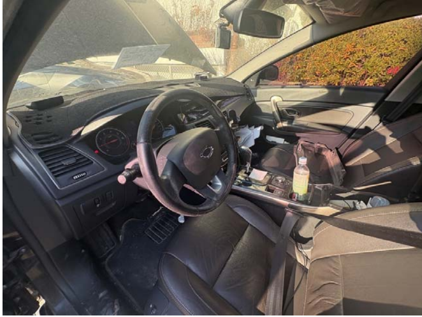
[ 본건 내부 ]