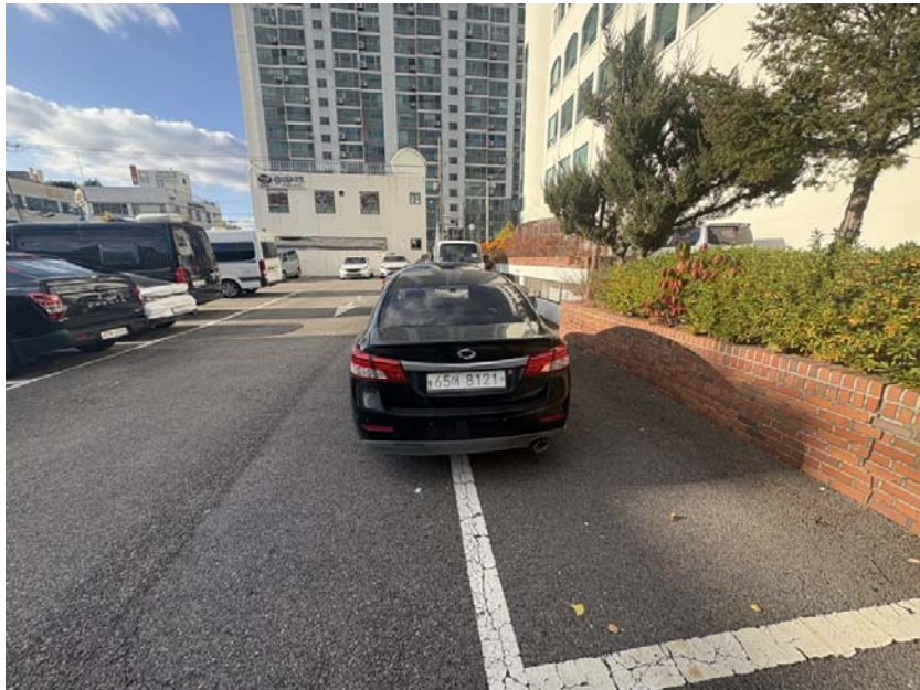
[ 본건 후면 ]