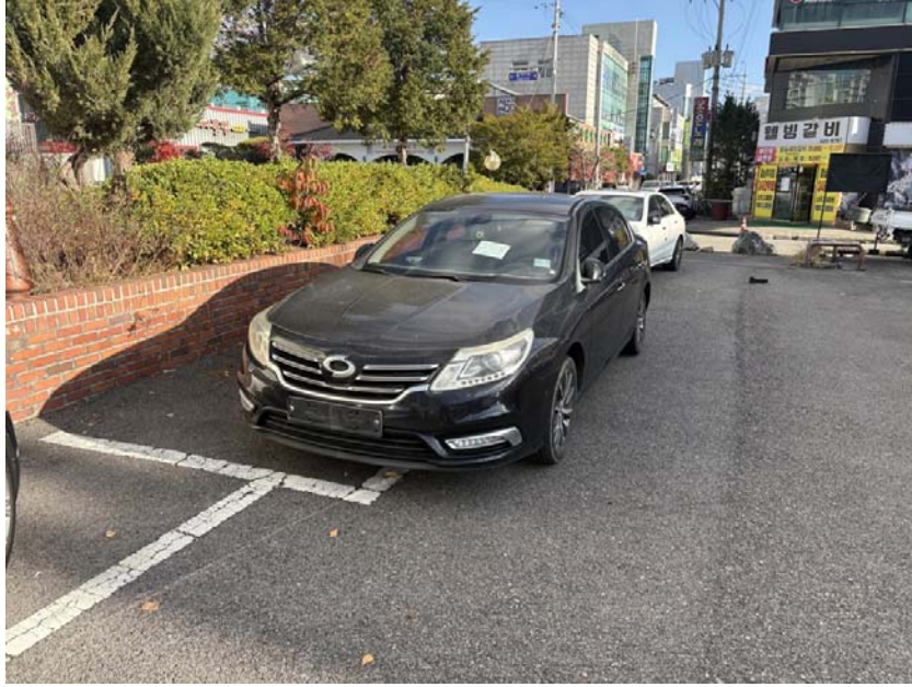
[ 본건 전면 ]