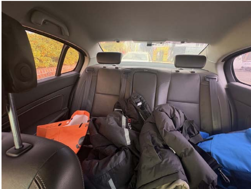
[ 본건 내부 ]