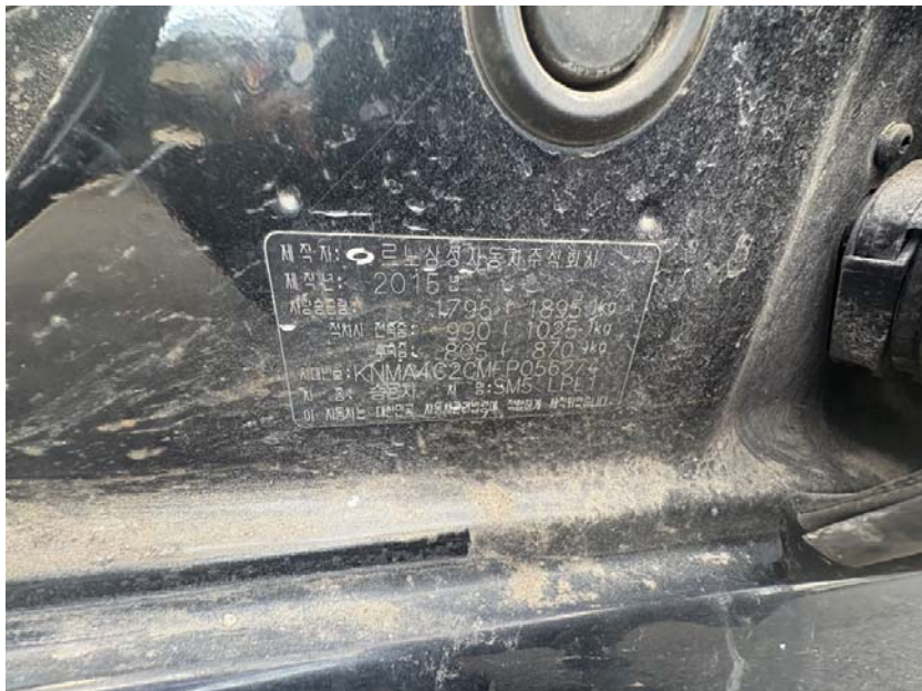
[ 본건 차대번호 ]