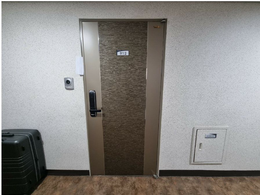
( 912 )