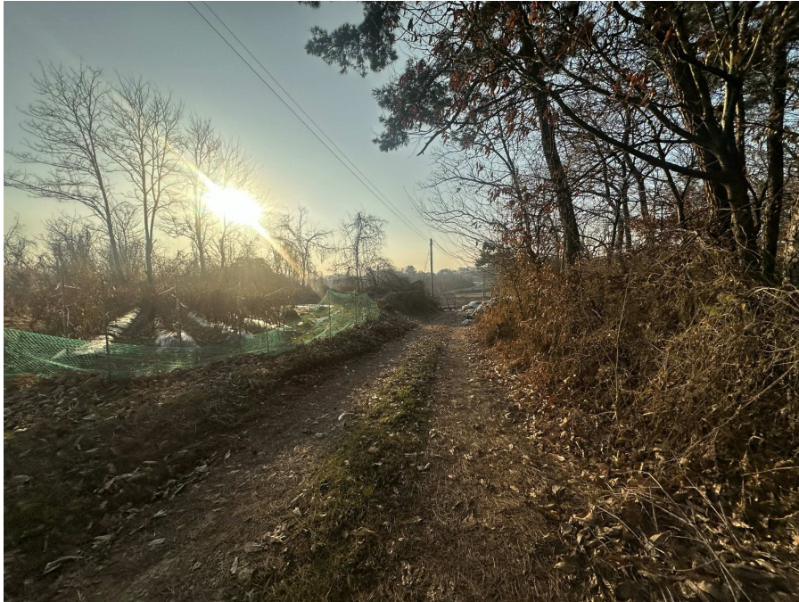
주위환경(본건 남측 진입로)