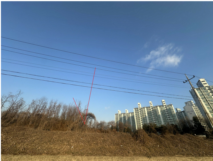
주위환경(남동측 도로에서 촬영)