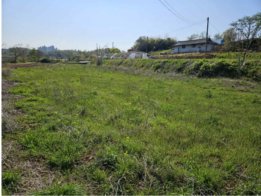
본건 전경 (남동측 촬영)