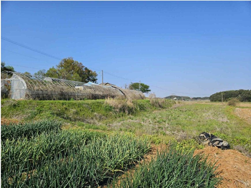
본건 전경 (남서측 촬영)