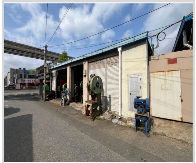
본건 기호 다) 전경