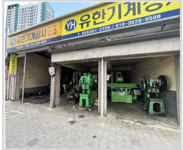
본건 기호 가) 전경