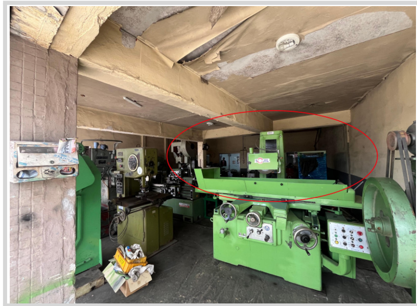
제시 외 건물 ㉠