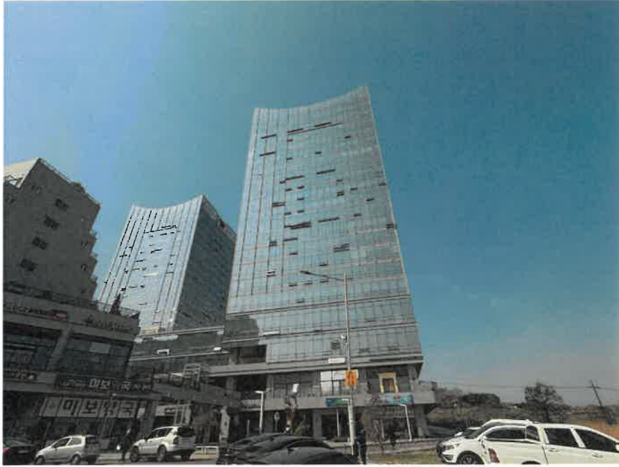
본건이 속한 건물 전경