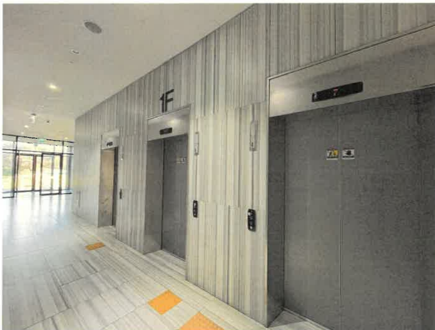
복도 및 엘리베이터 설비