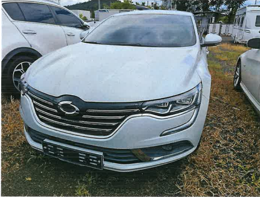
본건 운전석쪽 전면