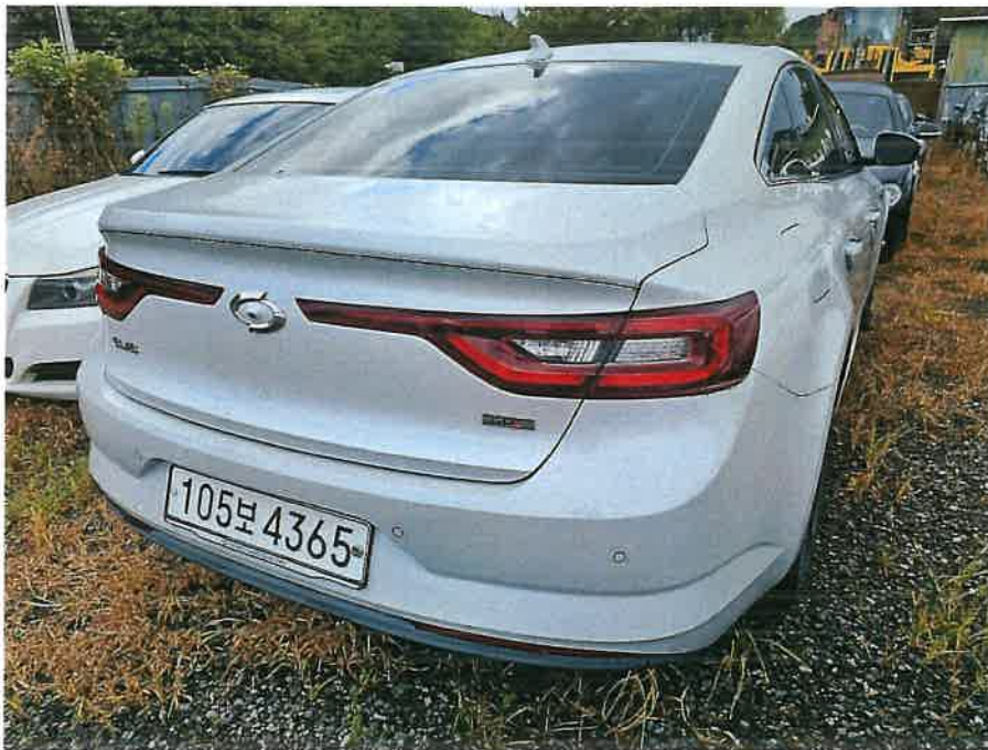
본건 조수석쪽 후면