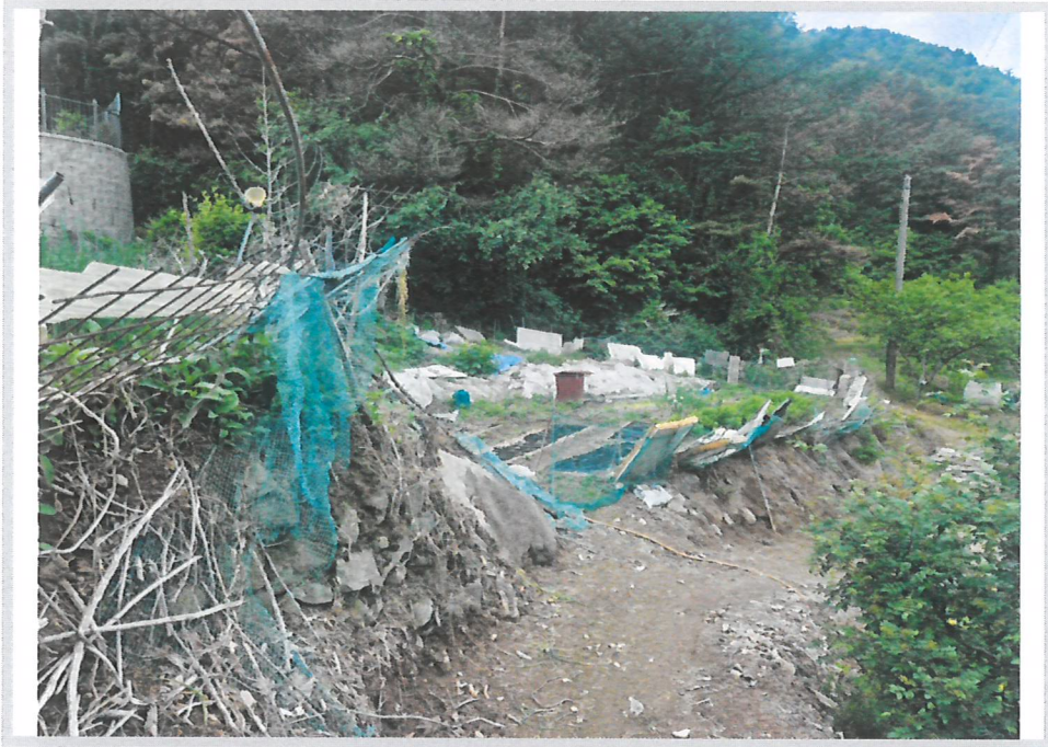
본건 북서측 부분 전경 (동측 비포장농로에서 촬영)