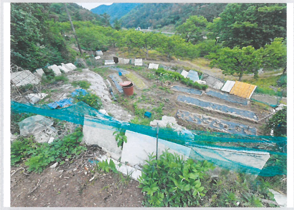
본건 북서측 부분 전경 (남동측에서 촬영)