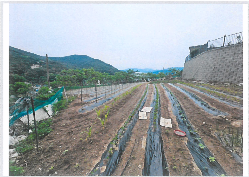
본건 전경 (북서측에서 촬영)