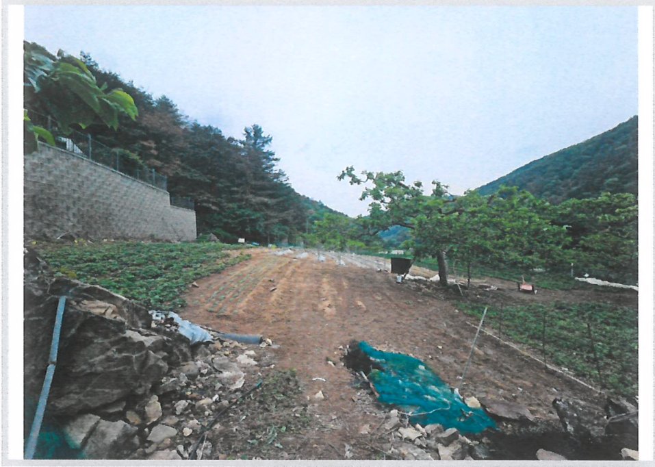
본건 전경 (남동측에서 촬영)