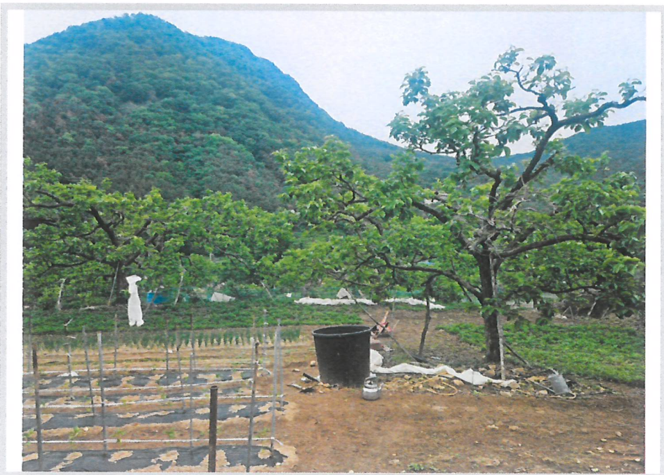
본건지상 과수목 상황