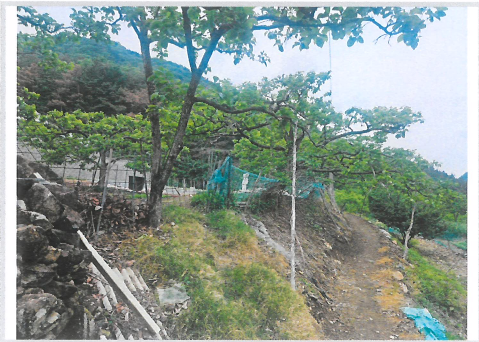
본건 전경 (동측 비포장농로에서 촬영)