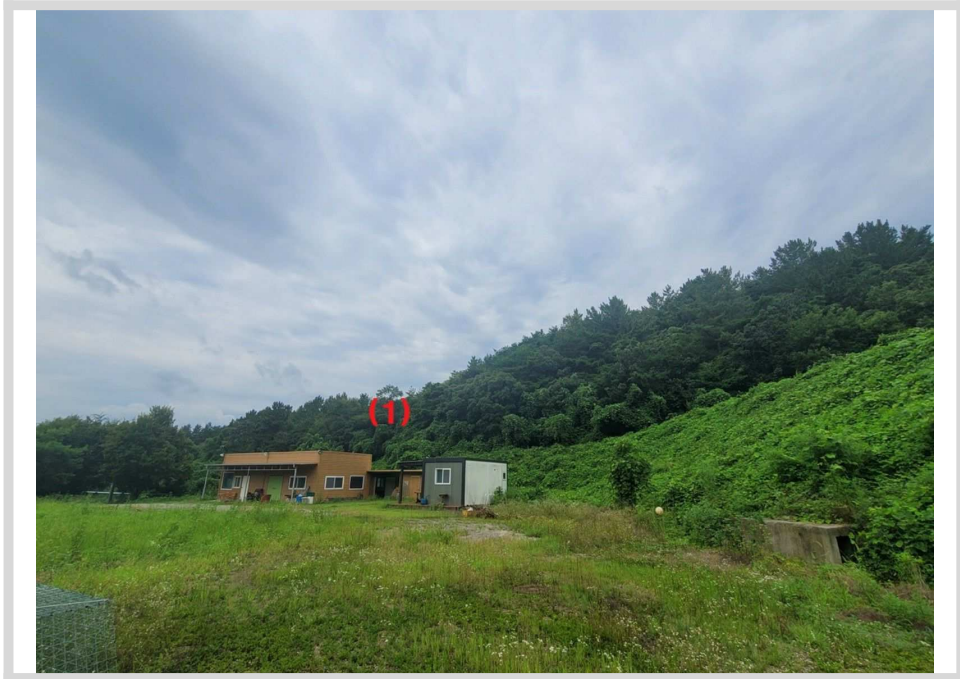
본건 및 주변전경 (동측 인근에서 촬영)