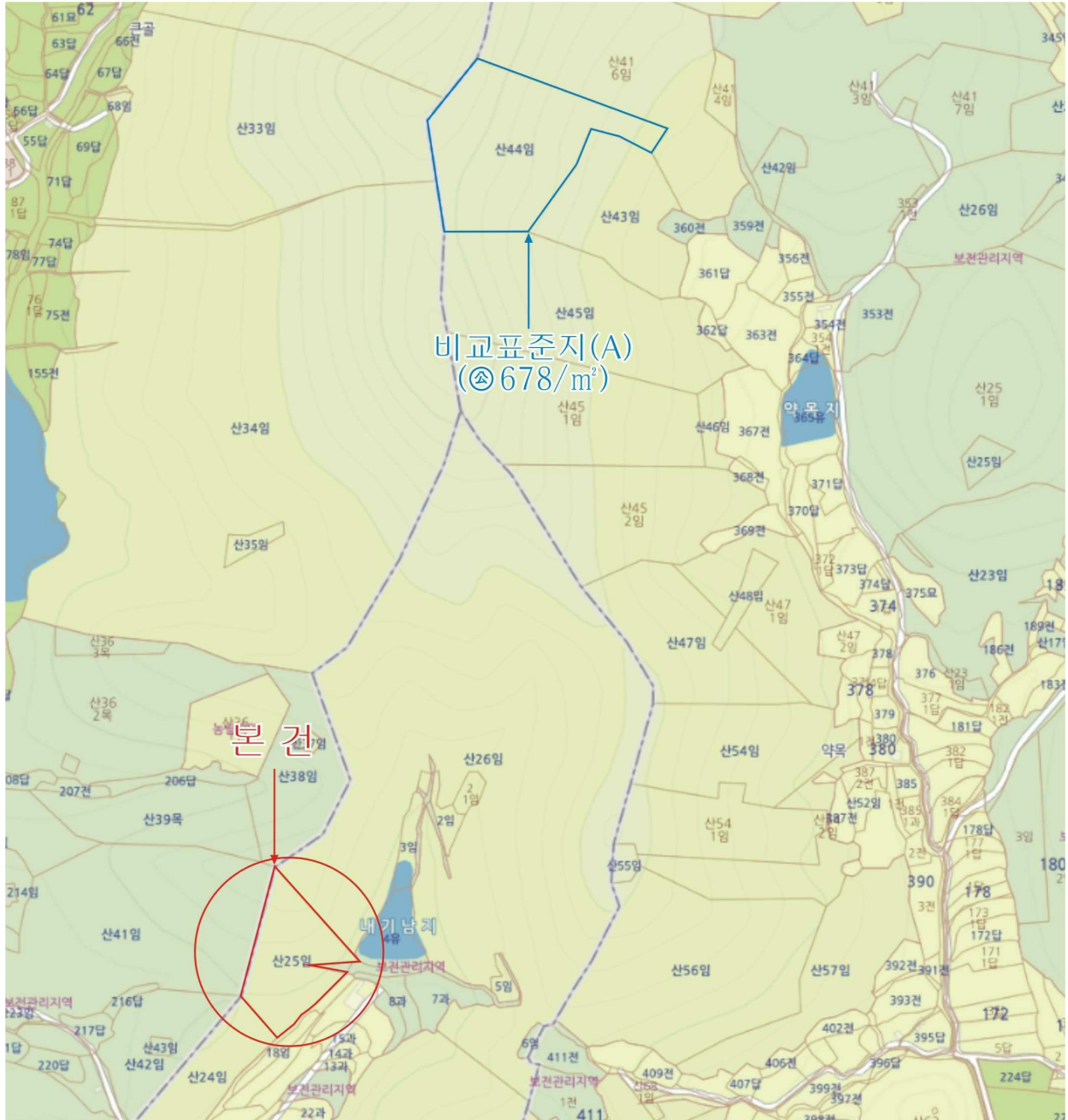
경상북도 영천시 대창면 어방리 산25