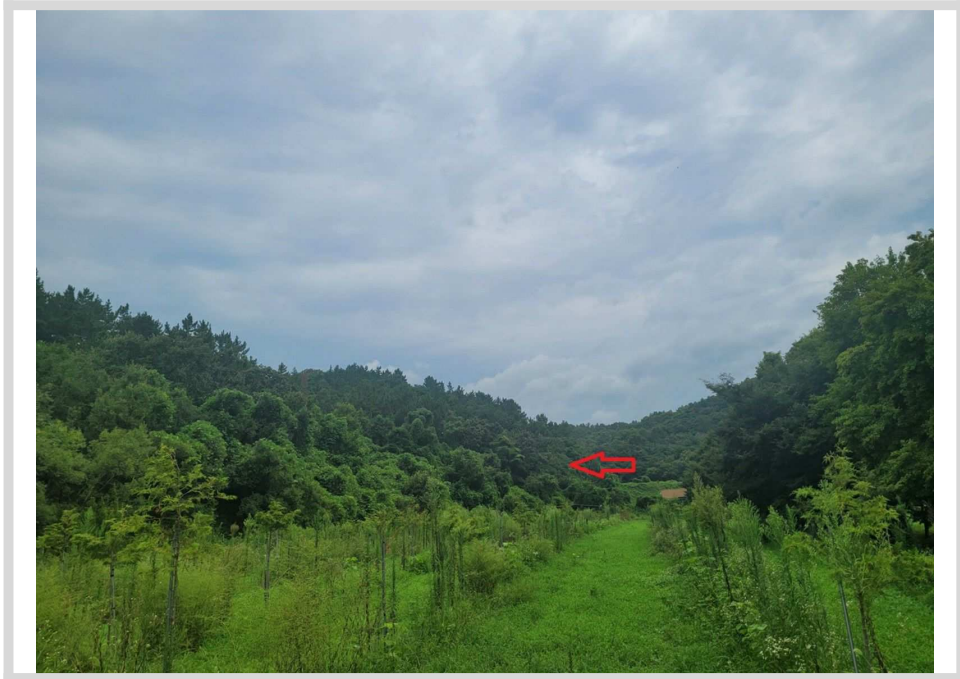
본건 및 주변전경 (남서측 인근에서 촬영)