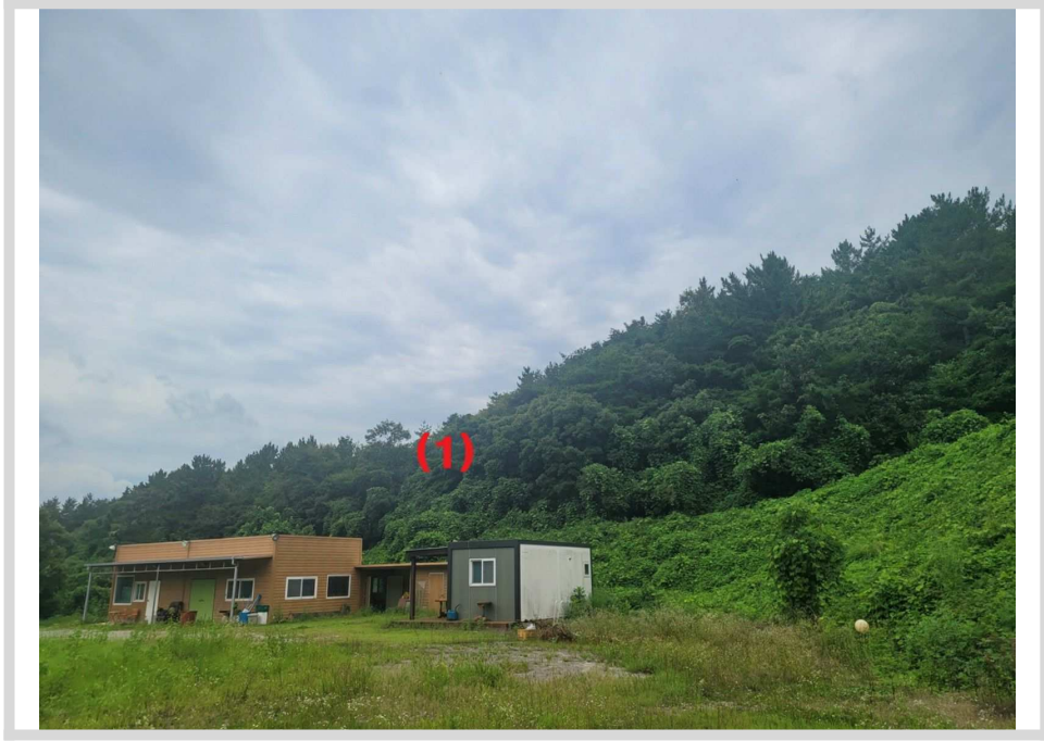
본건전경 (동측 주변에서 촬영)