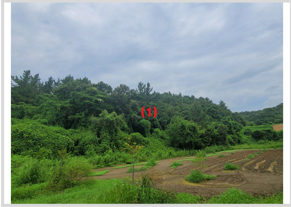
본건전경 (남측 주변에서 촬영)