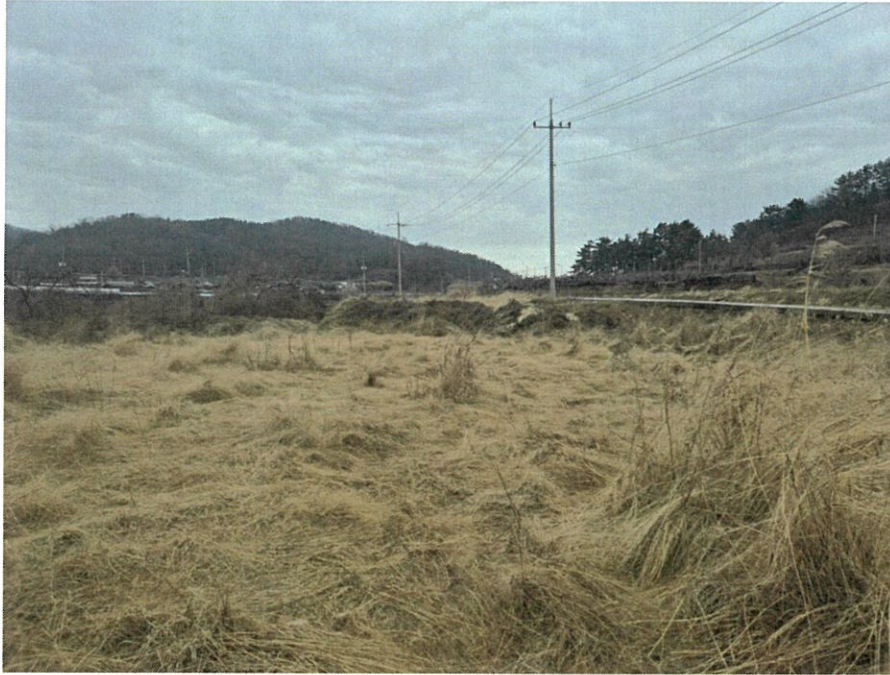
[본건 내부 전경]