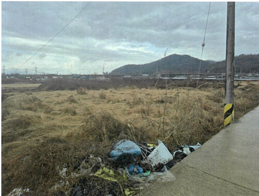
[본건 전경(본건 남동측에서 촬영)]