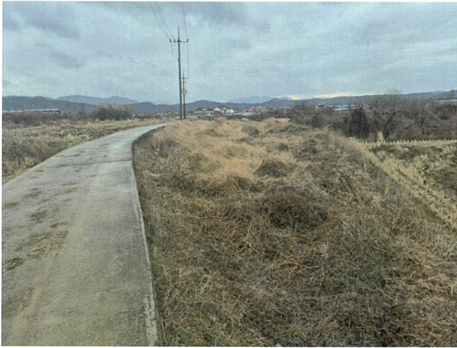
[본건 전경(본건 북동측에서 촬영)]