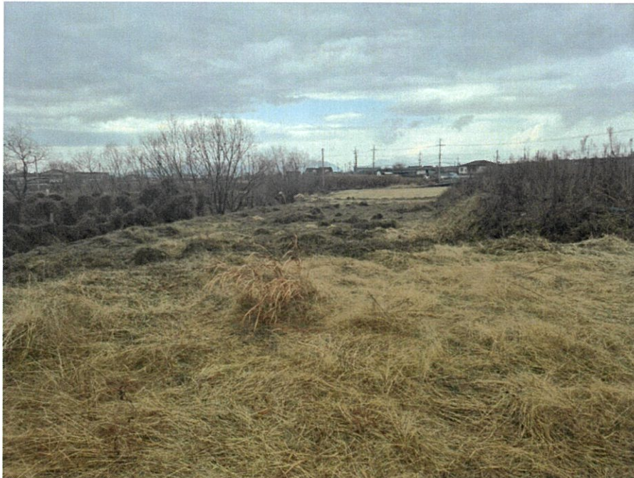
[본건 내부 전경]