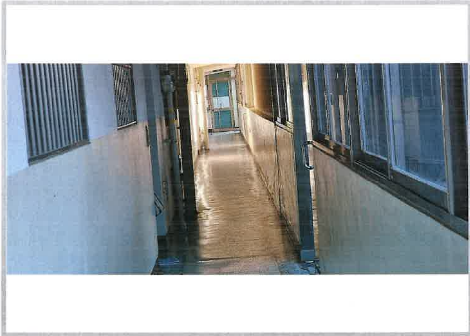
본건 아파트(101동) 1층 복도