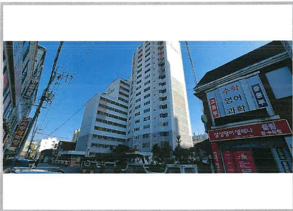
본건 아파트(101동) 외부 전경