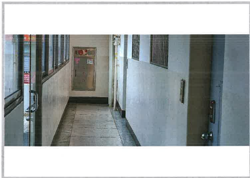
본건 아파트(101동) 1층 복도