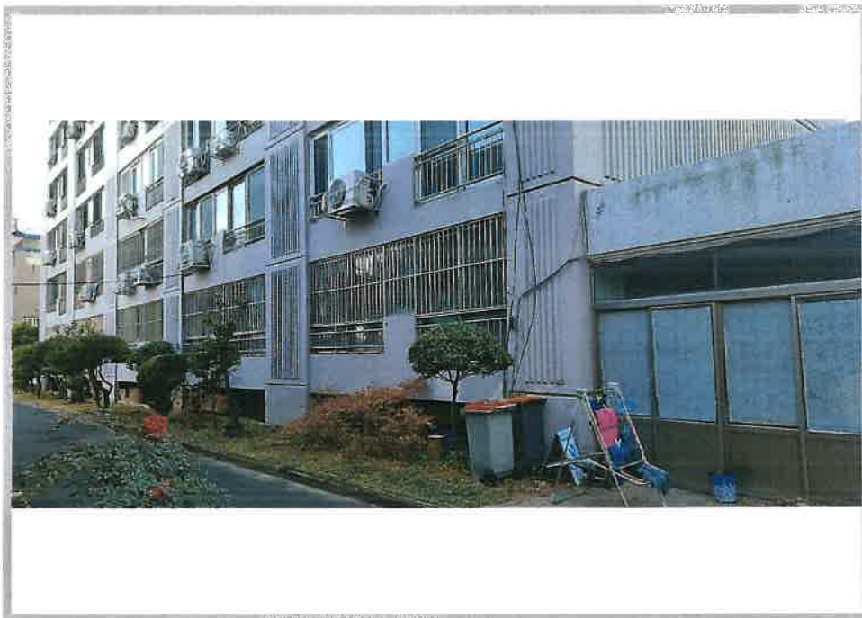
본건 아파트(108호) 외부 전경