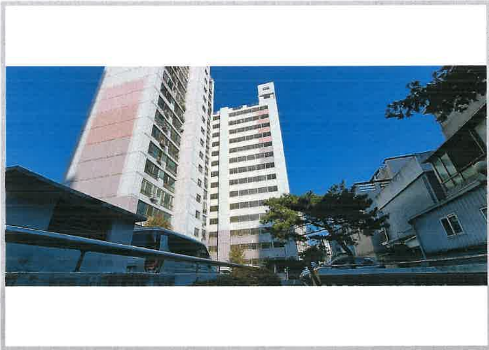
본건 아파트(101동) 외부 전경