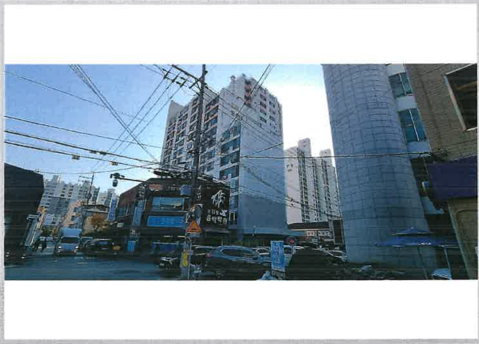
본건 아파트(101동) 외부 전경