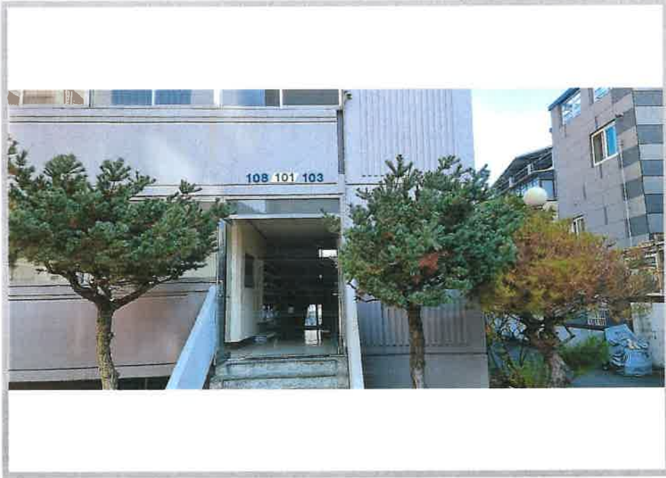
본건 아파트(101동) 3~8호라인 1층 출입문