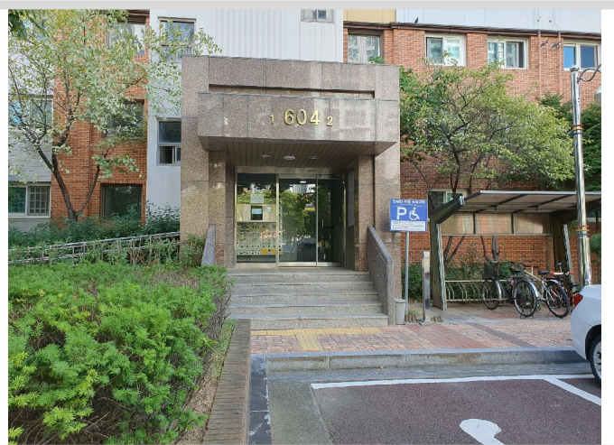
604 1, 2