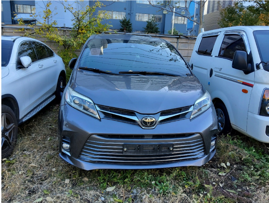
Si enna 2VD