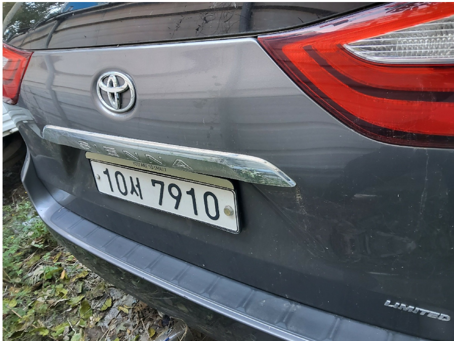
Si enna 2VD