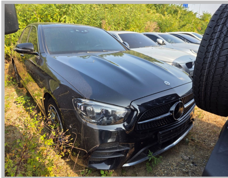
[본 건 전 경]