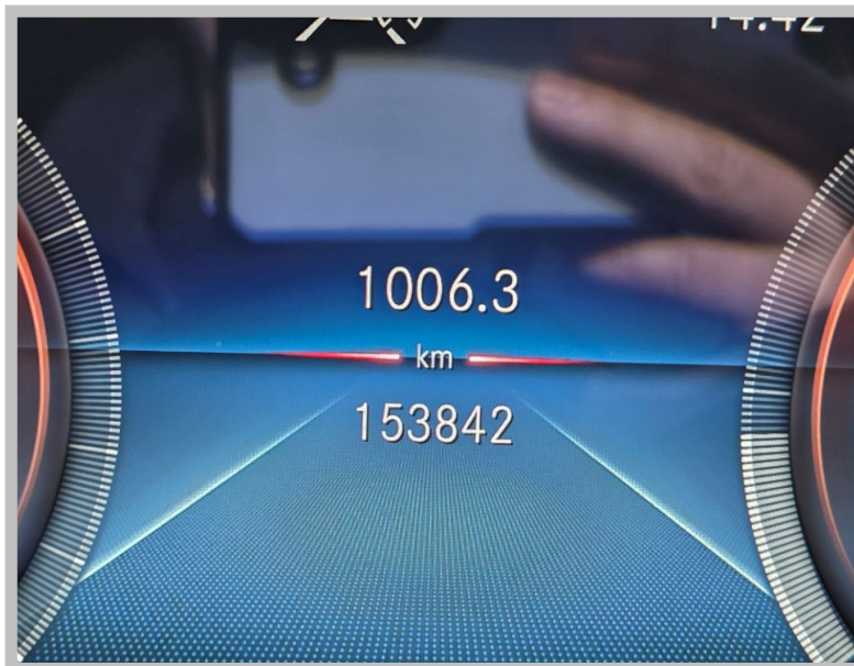
[본건 계기판 전경]