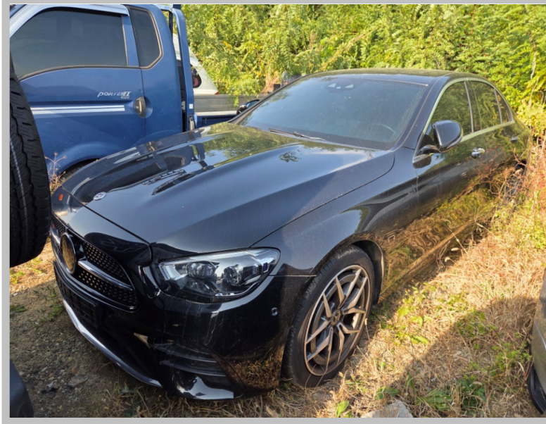
[본 건 전 경]