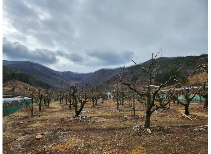
본건 전경(북동측에서 촬영)