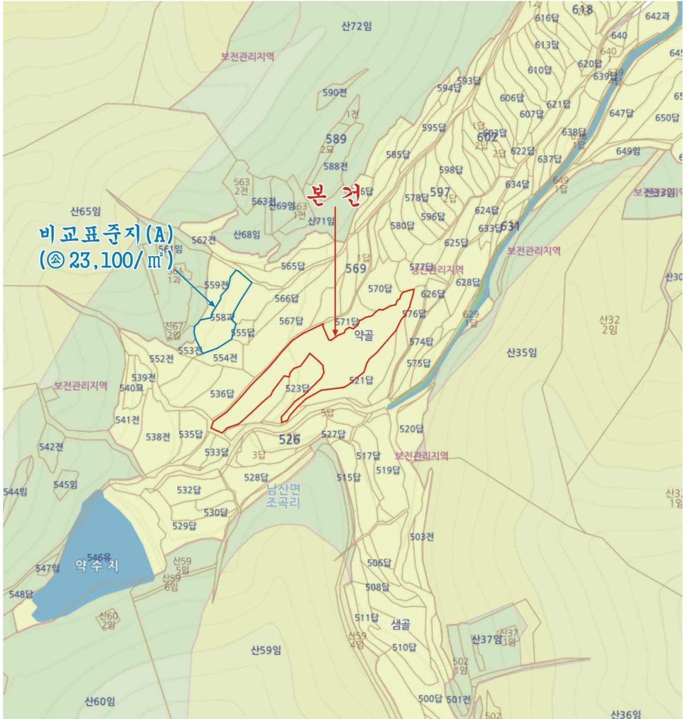
경상북도 경산시 남산면 조곡리 572