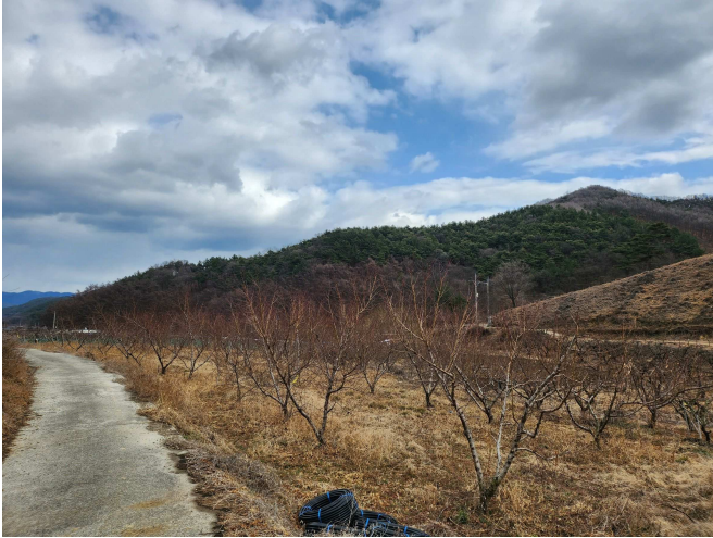
본건 전경(남서측에서 촬영)