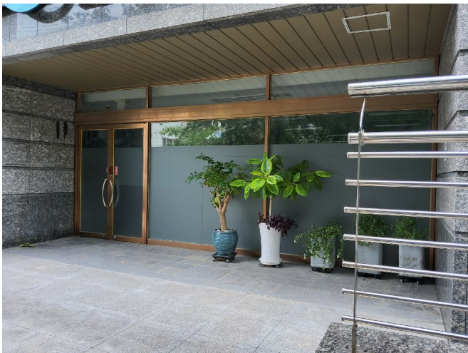
1 1 110