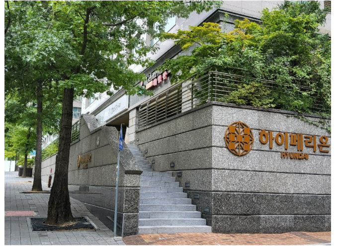
1 1 110