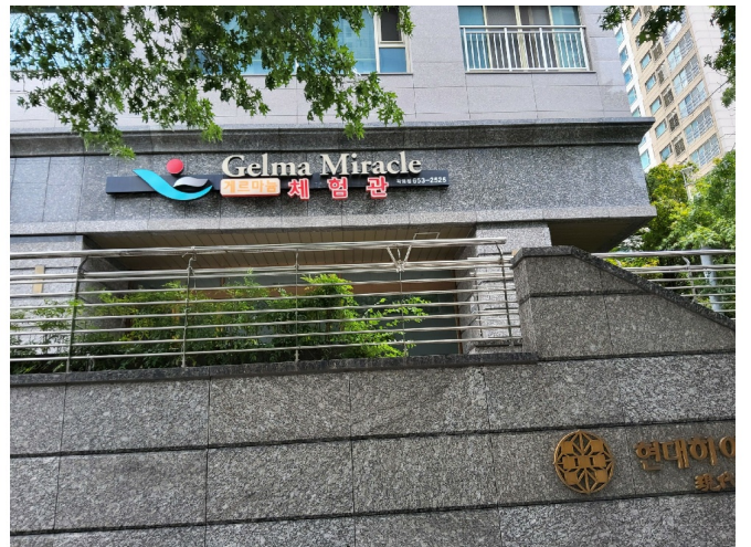
1 1 110