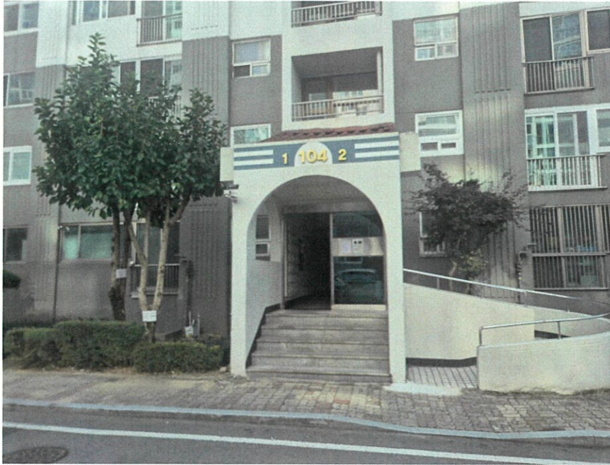
[1층 주 출입구]